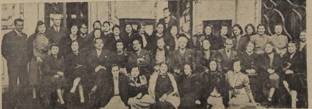
Asistentes al almuerzo ofrecido ayer en el Liceo de Niñas N.º 6 con motivo de su aniversario

Con motivo de celebrarse el vigésimo aniversario de la fundación del Liceo de Niñas N.º 6, de Santiago, la Dirección y Profesora del establecimiento ofrecieron a las autoridades educacionales un almuerzo, al cual asistió