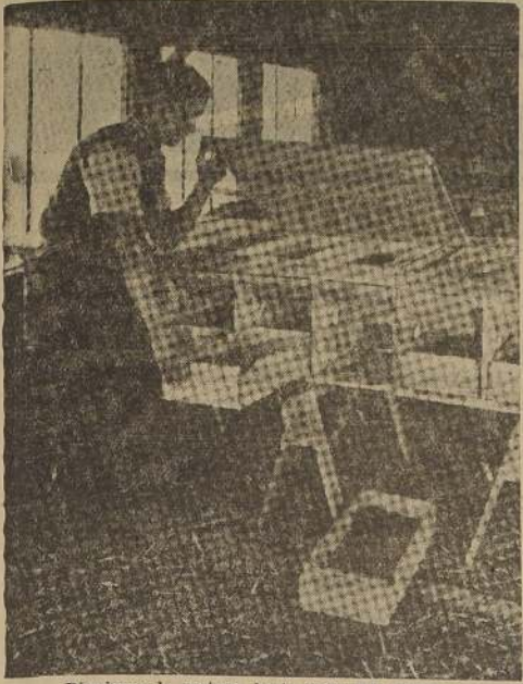
Disminuye la postura, hasta cesar por completo.

(Colaboración del Departamento de Sanidad Vegetal del Ministerio de Agricultura).