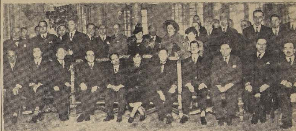
Asistentes a la ceremonia efectuada ayer en la Embajada de Bolivia.