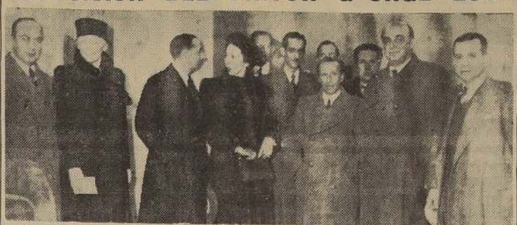
Asistentes a la inauguración de la exposición de las obras del pintor norteamericano Georges Lusk, efectuada ayer en la Sala Chile, bajo los auspicios de la Sociedad Amigos del Arte y del Instituto chileno-norteamericano de Cultura. A este acto concurrieron el Embajador de Estados Unidos, distinguidas personalidades y un numeroso público.