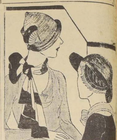
A la izquierda: sombrero de fieltro, hecho de tiras recortadas y cosidas, como si fuera trenzadas. Modelo de Simón. El sombrero de la derecha es de Blanche et Simon, en fino crin de Milán, adornado de terciopelo y de gran grain plegado muy fino.