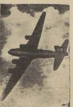
El cuatrimotor "Condor", de la Focke-Wulf.

Alemania acaba de producir el más confortable avión para pasajeros, provisto del confort máximo, y de todos los requisitos de seguridad que impone la técnica. Posee cuatro motores y desarrolla una velocidad de 345 kilómetros por hora, con un consumo de combustible muy económico. Usando motores más potentes del mismo tipo, puede alcanzar una velocidad de 420 kilómetros por hora, a una altura de 3.500 metros. Sabido es que los aparatos de