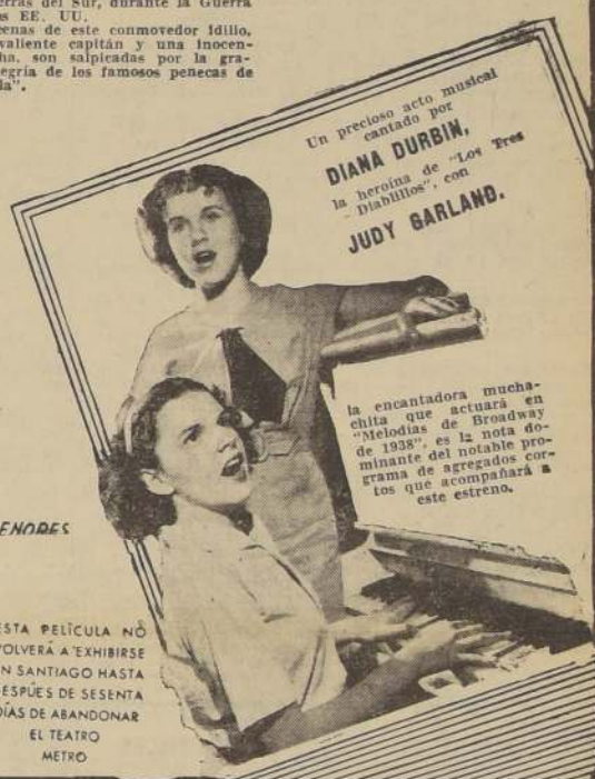
Un precioso acto musical cantado por DIANA DURBIN , la heroína de "Los Tres Diabólicos", con JUDY GARLAND .

Un dramático romance de amor desarrollado en tierras del Sur, durante la Guerra Civil de los EE. UU. Las escenas de este conmovedor idilio, entre un valiente capitán y una inocente muchacha, son salpicadas por la gracia y la alegría de los famosos penecas de "La Pandilla".