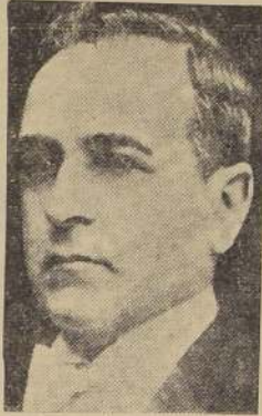
Excmo. señor Getulio Vargas

Expresó que el caos político y la situación económica de la nación hacían necesaria la adopción de la medida tomada, añadiendo que el remedio se contemplaba en la nueva Carta