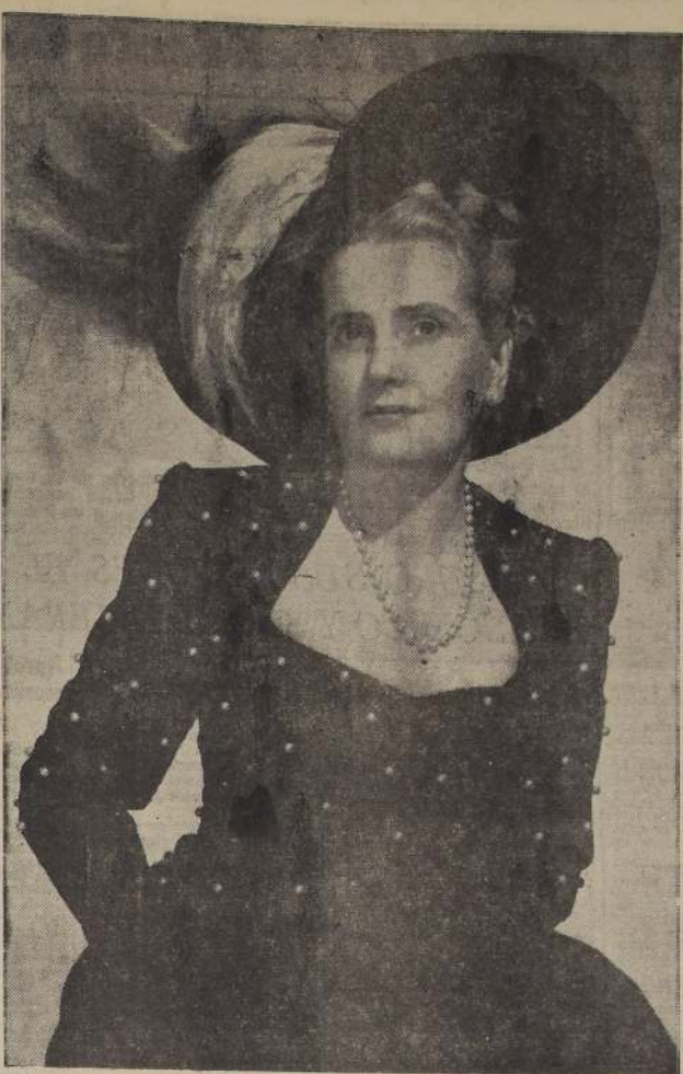
SEÑORA ROSA MARKMANN DE GONZALEZ VIDELA, esposa del Excmo. señor Gabriel González Videla, Primera Dama que acompaña, como invitada de honor, a su esposo, en viaje oficial a los Estados Unidos.