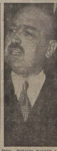
Señor HORACIO WALKER LARRAÍN, Ministro de Relaciones Exteriores, que acompañará a S. E. en su importante visita a Estados Unidos.

Llegada a Guayaquil donde lo espera el Presidente Gaio Plaza.