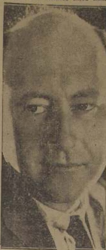
Cecil B. de Mille