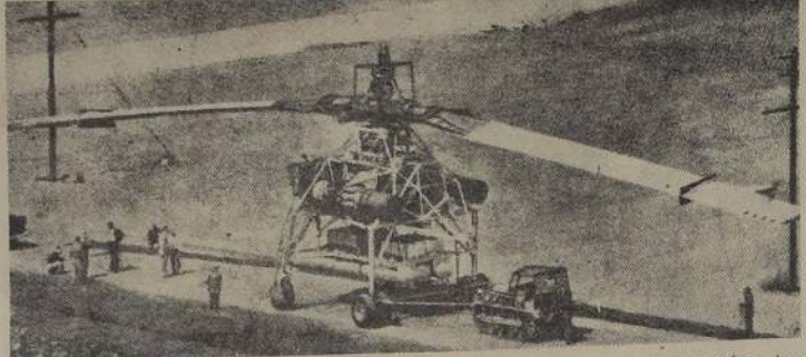
El estricto secreto que mantenía Howard Hughes acerca de su nueva máquina aérea terminó la semana última cuando el XII-17 fue sacado de su hangar para ensayar al aire libre. Las fotografías tomadas en esa ocasión muestran a un gigantesco helicóptero destinado al transporte de tanques y misiones tácticas.

Durante el breve lapso que estuvieron en la ciudad visitaron acompañados del Embajador, algunas partes céntricas.