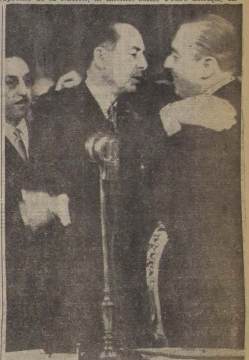
LOS MANDATARIOS SE ABRAZAN.— El Excmo. señor Gabriel González abraza al Excmo. señor Pedro Enrique Alfonso, después de haberle hecho entrega del mando supremo de la nación.

Mientras se realizaban todas estas manifestaciones públicas, LA NACION hizo ayer una segunda encuesta pública sobre el viaje del Presidente, la que demostró de nuevo que el pueblo acompaña cariñosamente a su Mandatario en este momento trascendental de su Gobierno, esperando que su visita a los Estados Unidos se traduzca en positivos beneficios para el país.