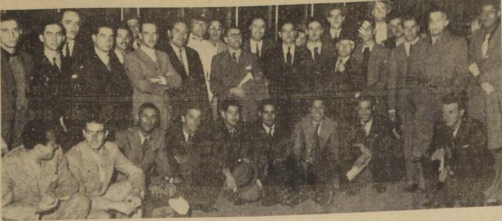
Las delegaciones extranjeras al campeonato de basketball a su arribo a la Estación Mapocho

De recordarse que en el primer tiempo los transandinos jugaron a voluntad, y que en el segundo los brasileños jugaron superando sus presentaciones.