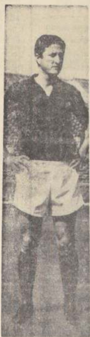
También a los administrativos