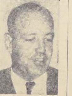
DOMINGO SANTA MARIA