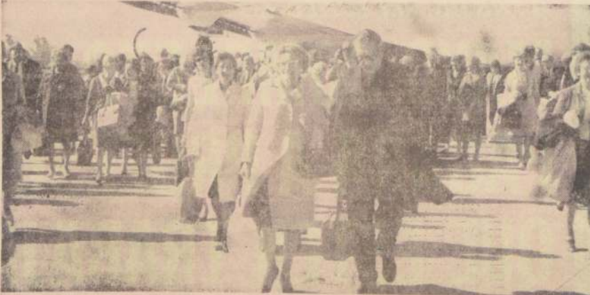
El más grande grupo de turistas llegado a Santiago, gracias a la promoción de Kearney Travel Service, Esprinter y Braniff International, visita desde ayer Santiago, en una gira que abarca Lima, Santiago, Buenos Aires, Montevideo, Sao Paulo y Río de Janeiro. El grupo pertenece al General Motors Girls Club, de Detroit. En el grabado, un aspecto de la llegada a Pudahuel.

De acuerdo con un informe del Instituto Hidrográfico de la Armada, el “tsunami” no será de mucha violencia, pero en todo caso recomienda tomar precauciones. Según los cálculos realizados, a las 13.30 horas, la misma que Valparaíso, la misma que Talcahuano, en Arica e Iquique se hará sentir diez minutos antes.