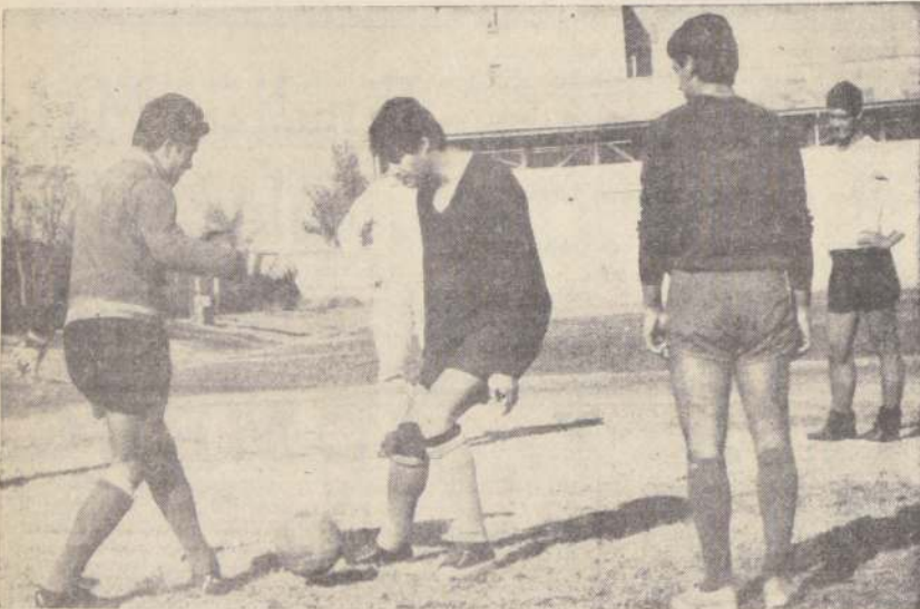
ARIAS Y TROILO "pichanguen". Un alto risueño en la seriedad del entrenamiento.