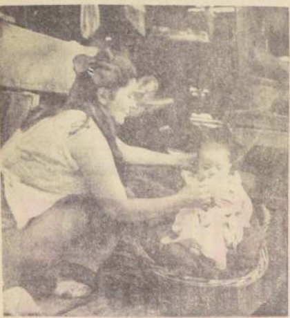
Chile está convertido en el pionero latinoamericano del control de natalidad. Así lo señalan las estadísticas que sirven para demostrar que ya existe formada conciencia sobre la paternidad y sus derivados.