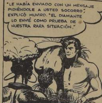
"LE HABÍA ENVIADO CON UN MENSAJE PIDIÉNDOLE A USTED SOCORRO", EXPLICÓ MUWRO. "EL DIAMANTE LO ENVIÉ COMO PRUEBA DE NUESTRA RARA SITUACIÓN."

S. SACK FIERRO NACIONAL SEGUNDO CUADRADO PLANO S. PABLO 1175 MORANOE 817