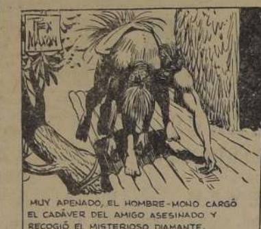
MUY APEMADO, EL HOMBRE-MONO CARGÓ EL CADÁVER DEL AMIGO ASEÑALADO Y RECÓGIO EL MISTERIOSO DIAMANTE.