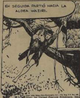
EN SEGUIDA PARTIÓ HACIA LA ALDEA WAZIRI.