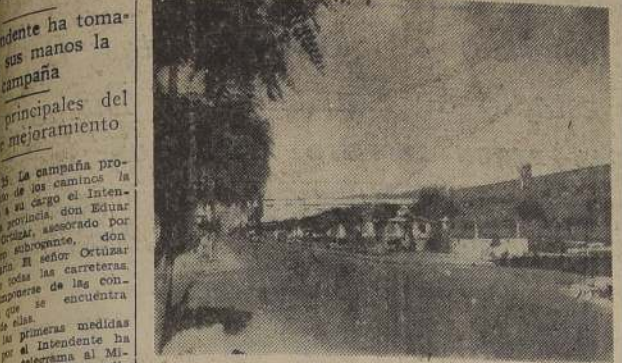
La plaza Cienfuegos y el edificio de las Escuelas Concentradas de Talca. El Intendente de la provincia ha tomado en sus manos la campaña pro mejoramiento de los caminos.