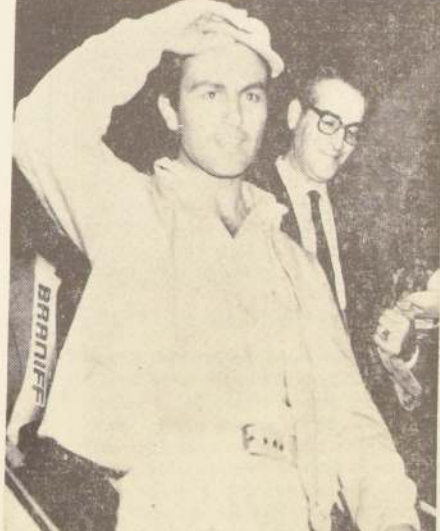
Por el jet de Braniff Internacional llegó al aeropuerto de Pudahuel, el actor, director de cine y cantante argentino, Leonardo Favio, quien participará en los primeros días en el "show" artístico del Décimo Festival Internacional de la Canción de Viña del Mar.