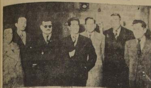
El Comité Central de Defensa de Empleados Particulares.

QUE HAN QUEDADO AL MARGEN DE LOS BENEFICIOS DE NUEVA LEY DE RENTAS