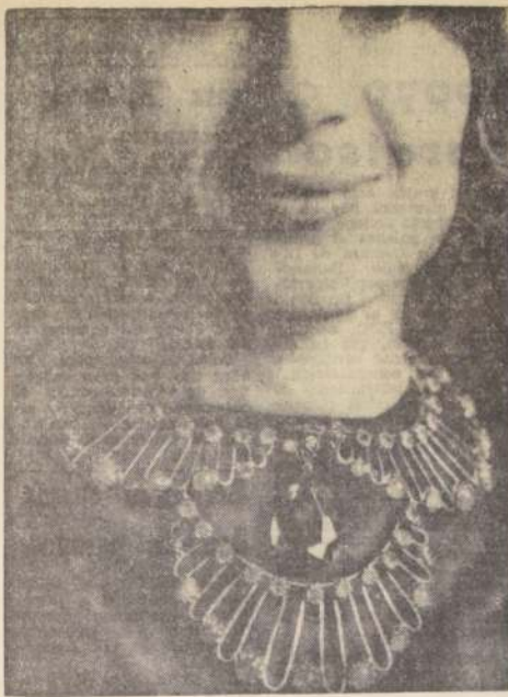
S. F. I. — "CINNA" original collar. Creación CIS, mención obligatoria.