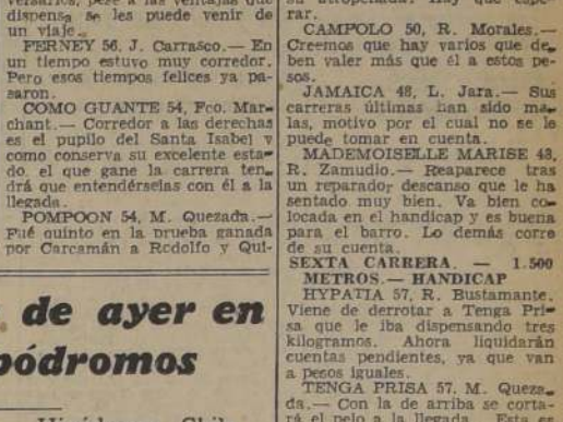
Hipodromo Chile Pista de arena, subida.