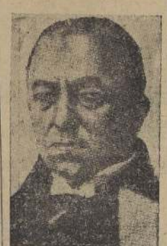
Dr. Emil Hácha.