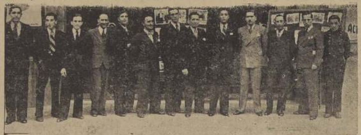
Parte del personal del Teatro Carrera, que celebra hoy su festival de beneficio.

Una fiesta de proporciones será la velada que ha de llevarse a cabo esta noche en la amplia y cómoda sala del Teatro Carrera, con motivo del beneficio anual de sus empleados.