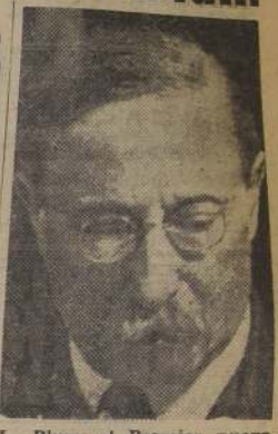
L. Blum, el Premier nuevamente derribado

NADA SENSACIONAL EN EL ACUERDO DE G. BRETANA - ITALIA