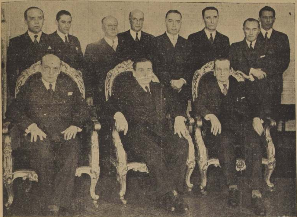
S. E. acompañado de sus Secretarios de Estado, antes del almuerzo que ofreció ayer en la Presidencia al Ministro de Defensa Nacional don Emilio Bello Codesido con motivo de su próximo viaje a Europa

Asistieron a esta manifestación todos los Ministros de Estado, altos Jefes de las Fuerzas Armadas y funcionarios públicos.— El señor Bello Codesido entregó el Ministerio de Defensa Nacional al señor Garcés Gana.— El cocktail de mañana en el Estadio Militar