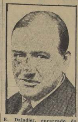
E. Daladier, encargado de organizar el Ministerio

La situación se hace más y más tirante. Hay la amenaza de una huelga general en señal de protesta por las maniobras del Senado. Los posibles nuevos Ministros. El problema financiero