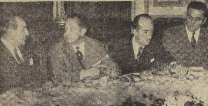
EL ROTARY CON LA PRENSA. — Un aspecto de la comita ofrecida anoche en el Club de la Unión por el Rotary de Santiago a la prensa y radio, con motivo de la iniciación, a contar del lunes próximo, de la Semana del Niño, que celebra tradicionalmente esta benemérita institución. Hubieron uso de la palabra, para re-