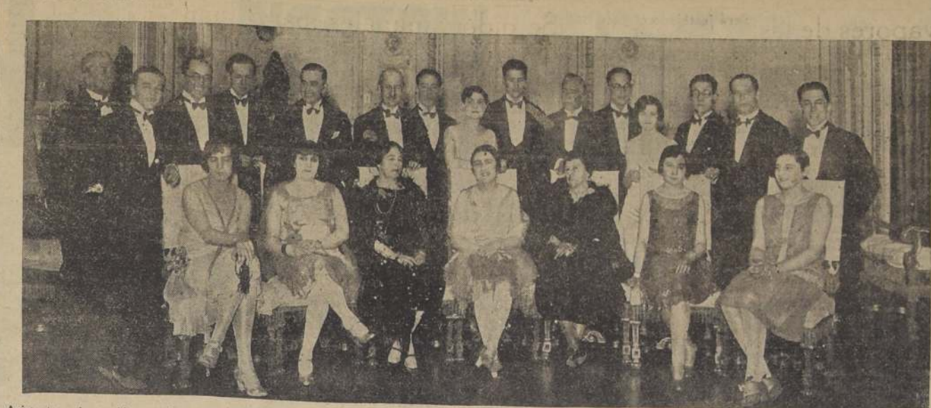
Asistentes a la comida que el secretario de la Legación de Colombia ofreció antenoche a los estudiantes colombianos que recibieron su título de médicos