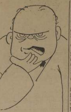
Las Memorias de Mr. Winston Churchill constituyen un documento muy interesante y revelador de nuestro tiempo.

Los señores inspectores corrian desahogados de un lado a otro, sin atinar a nada que fuera en beneficio del público. Así debe haber transcurrido quien sabe cuánto tiempo, porque el que esto escribía, al igual que la gran mayoría de los pasajeros, optó por abandonar el vehículo cuando se vio obligado a salir a la calle, para no sufrir el inconveniente de ser conducido al término de su viaje.