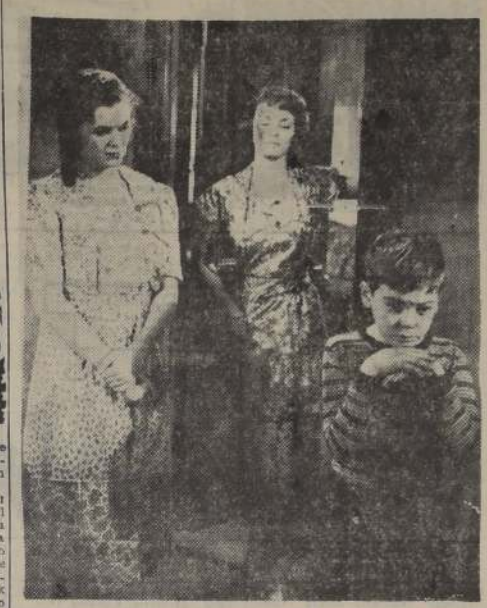
Bobby Driscoll, el pequeño muchacho de once años, ha sido entregado por la indiferencia pública a la mas cruel y despiadada persecución. Nadie cree el crimen que vio cometer, pero los asesinos han decidido darle muerte. Junto a él en esta escena, su madre, Barbara Hale, que le obliga a dar disculpas a Ruth Roman, coautora del crimen. En el sensacional superdrama "La Ventana".

Hoy inicia su séptima semana en el Teatro Plaza la superproducción "La ventana", cuyo éxito ha sido resonante. Esta superdrama de la RKO Radio está causando sensación en Santiago. De todas partes, de todos los barrios, viene el público a ver esta extraordinaria historia de un muchacho de once años a quien el destino pone como testigo único de un horrible crimen, pero nadie cree su denuncia. Bobby Driscoll, queda así entregado a los asesinos, quienes han decidido darle muerte. Nadie ha sufrido persecución más implacable que la que sufre Bobby Driscoll en este sensacional film. Barbara Hale, Arthur Kennedy, Paul Stewart y Ruth Roman, completan el reparto de esta película. El pequeño Bobby Driscoll es uno de los candidatos con más opción a uno de los premios más altos de la Academia Cinematográfica de Hollywood.