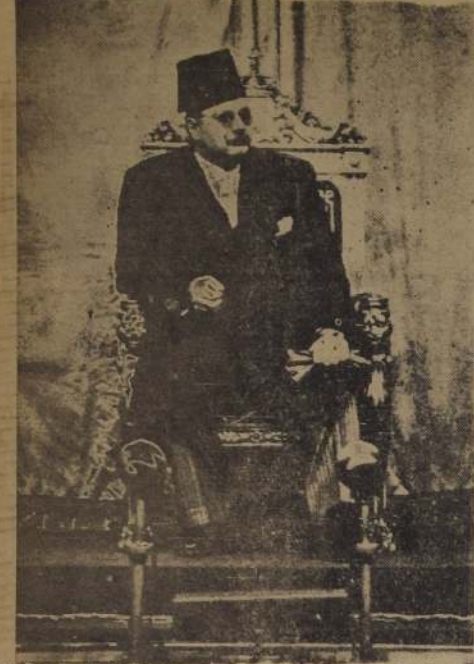
El Rey Faruk de Egipto preside la sesión de apertura del Parlamento y escucha el discurso del Premier Nahas Pasha.