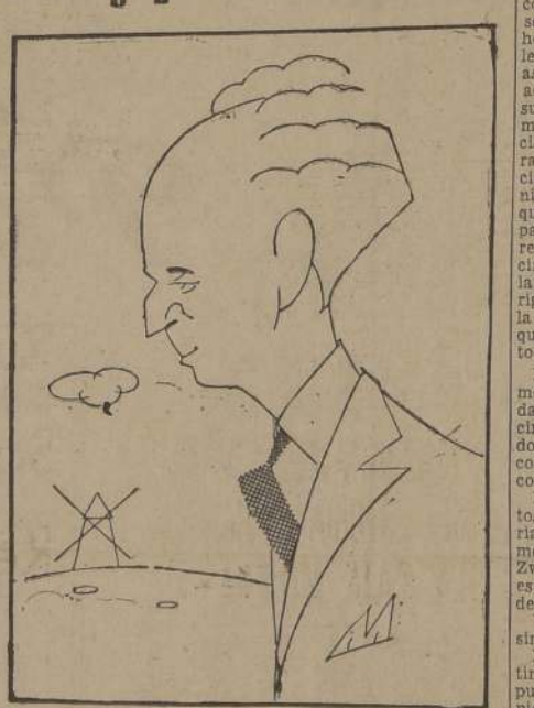
El rey de Bélgica, Leopoldo III, cuya vuelta al trono será decidida por un plebiscito.