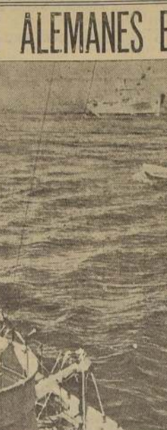
El almirante Raeder, jefe de la flota de guerra alemana, pasando revista a la flota de submarinos, al término de las maniobras realizadas a fines del mes pasado en el Báltico. Raeder saluda a la tripulación de un submarino con su bastón de Gran Almirante, título que no hace mucho le otorgó Hitler

MANIOBRAS DE SUBMARINOS ALEMANES EN EL BALTICO