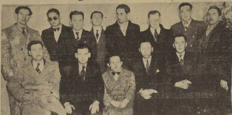
El Directorio y socios fundadores del Sindicato Profesional de Propagandistas de Ramos Comerciales, organización que se propone desarrollar interesantes actividades en favor del gremio.

Los Sindicatos de las Minas Sewell enviaron $ 5.000