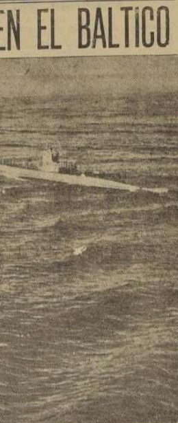
El almirante Raeder, jefe de la flota de guerra alemana, pasando revista a la flota de submarinos, al término de las maniobras realizadas a fines del mes pasado en el Báltico. Raeder saluda a la tripulación de un submarino con su bastón de Gran Almirante, título que no hace mucho le otorgó Hitler

MANIOBRAS DE SUBMARINOS ALEMANES EN EL BALTICO