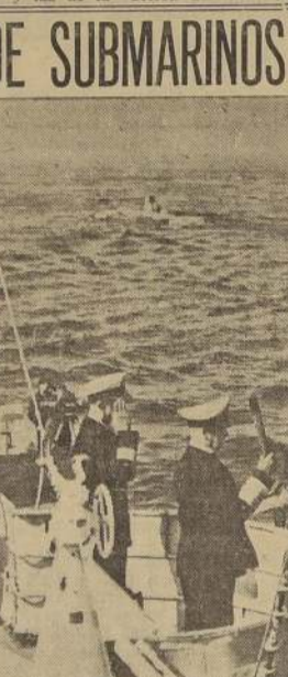
El almirante Raeder, jefe de la flota de guerra alemana, pasando revista a la flota de submarinos, al término de las maniobras realizadas a fines del mes pasado en el Báltico. Raeder saluda a la tripulación de un submarino con su bastón de Gran Almirante, título que no hace mucho le otorgó Hitler

MANIOBRAS DE SUBMARINOS ALEMANES EN EL BALTICO