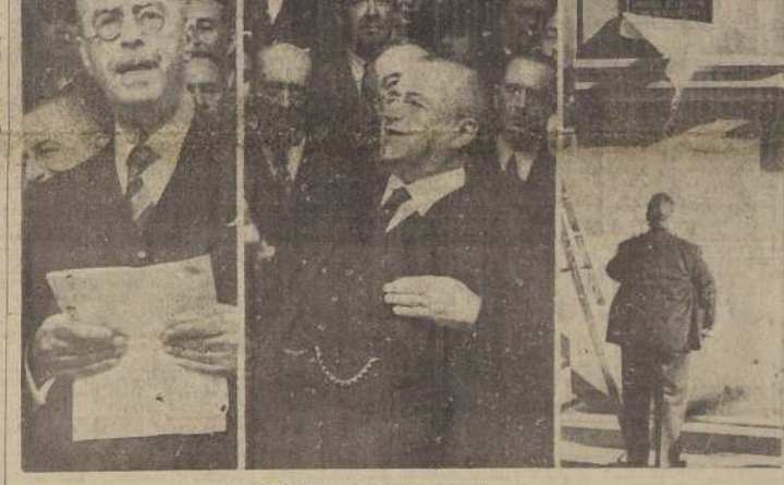
Tres aspectos de la ceremonia de ayer

COCKTAIL EN EL INSTITUTO DE CREDITO INDUSTRIAL