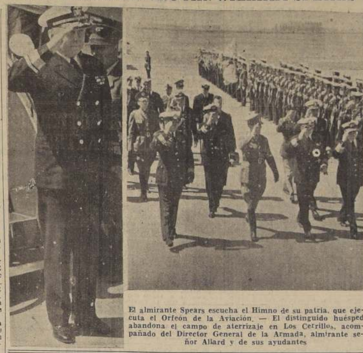
El almirante Spears escucha el Himno de su patria, que eja- cuta el Orfeón de la Aviación. — El distinguido huésped abandona el campo de aterrizaje en Los Cerrillos, acom- pañado del Director General de la Armada, almirante se- ñor Allard y de sus ayudantes

FATH HNOS. CIA. LTDA. RELOJERIA SUIZA AHUMADA 172/174 SUC. AHUMADA 334