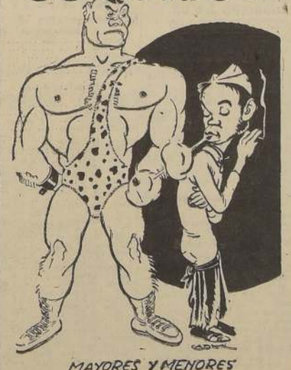
MAYORES Y MENORES

POSA FILMS S.A. Presenta a su Artista Exclusivo