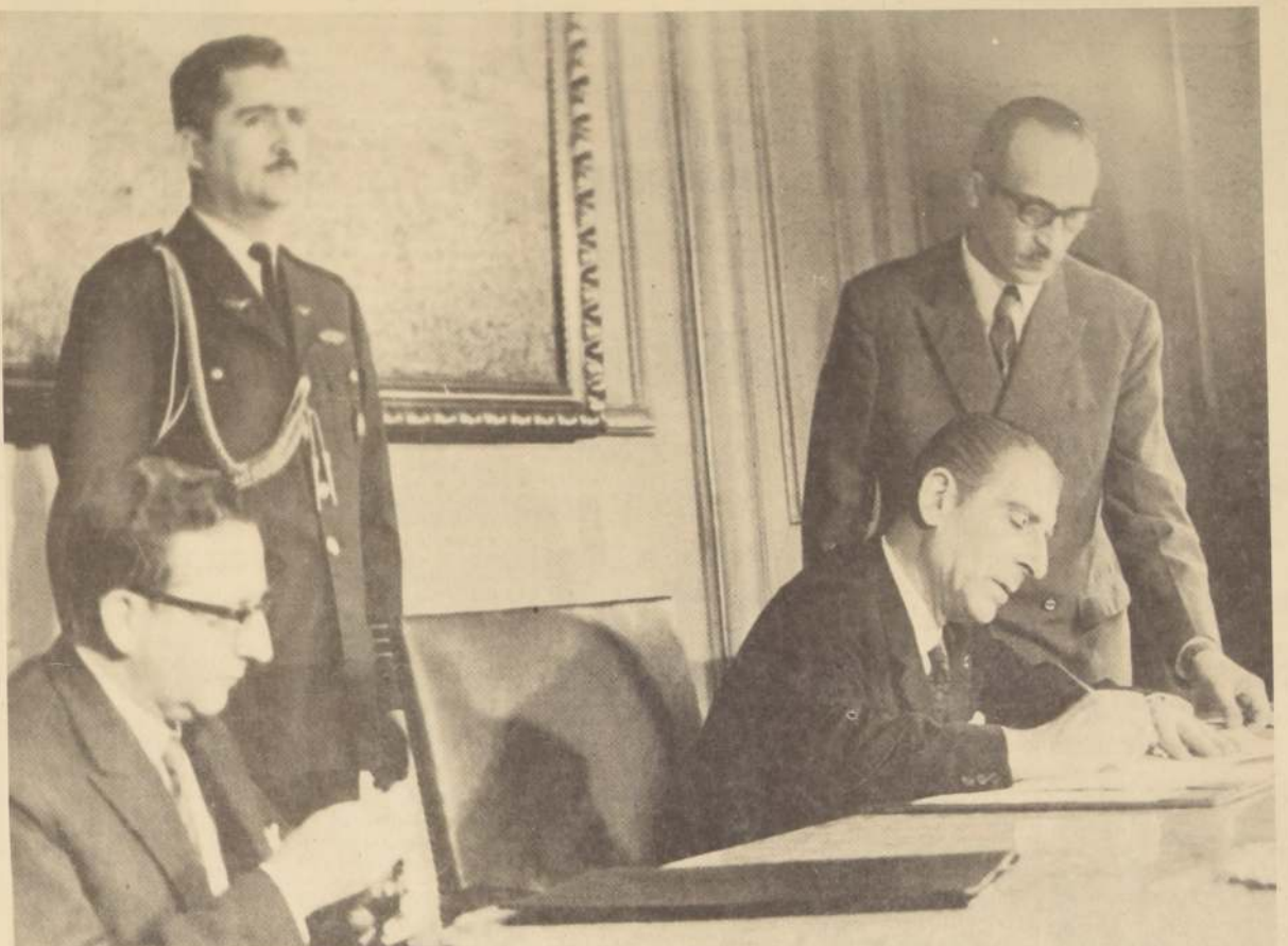
EL PRESIDENTE FREI promulgó ayer en la mañana la Ley de Conservación del Patrimonio y Estímulo de las Actividades Artísticas, que traduce la constante preocupación del Gobierno por las necesidades de orden espiritual que

La creación de un Registro Nacional de Obras de Arte, la obligación de ornamentar gradualmente los edificios públicos de las principales ciudades del país, la liberación de impuestos para la