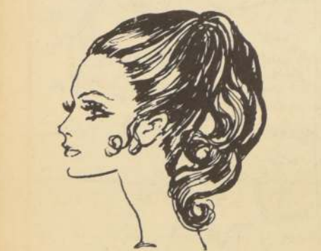
Destaque su Rostro