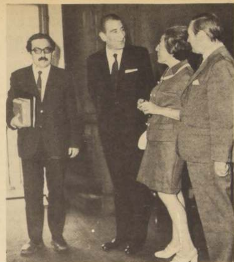
LOS ESCRITORES pidieron a Frei una ley que financie, en forma independiente, a la SECH.

En Nueva Zelanda y en Indonesia se establecerán los primeros contactos para iniciar el intercambio comercial, con esos países que significan importantes mercados potenciales para algunos de nuestros productos.