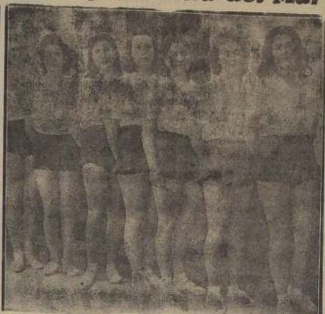
EQUIPO DE BASQUETBOL.— Este es uno de los equipos de básquetbol integrado por alumnos del Instituto de Educación Física, y que hoy se presentará en Viña del Mar.