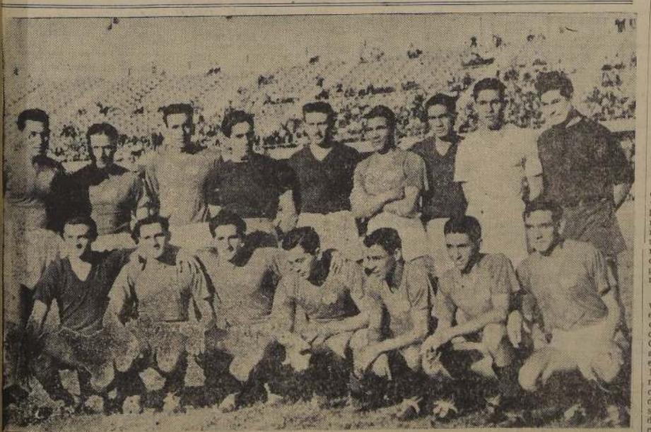
Equipo del Audax Italiano, reforzado, que ayer, en el Estadio Nacional, se impuso sobre el equipo argentino del Atlanta, por la cuenta de 4 a 2