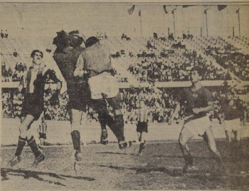
En uno de los serios momentos por que atravesó el arco argentino en la contienda internacional de ayer