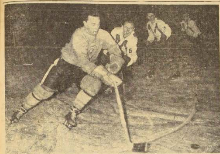
EL EQUIPO francés de hockey sobre hielo, venció recientemente, en el Palacio de Deportes de París, al poderoso conjunto de los Estados Unidos.

to "Meleor", de Budapest por la cuenta de 11 a 4. El grabado muestra una fase del partido, deporte que cuenta con una gran masa de adeptos durante la temporada de invierno.