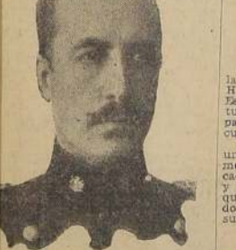
General Arturo Oyarzun Lorca

El Ministerio del Interior dictó ayer un decreto por el cual se autoriza al Intendente de Tarapaca,