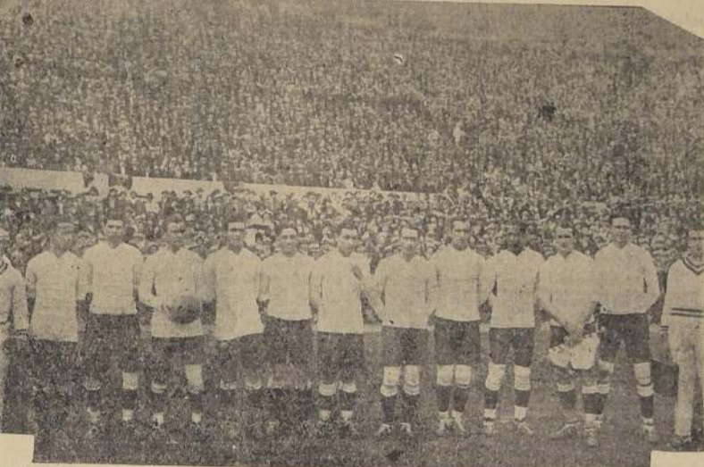
Equipo uruguayo que actuó frente a los peruanos. Al fondo, puede apreciarse la gran cantidad de espectadores cuyo número es siempre considerable, cuando se trata de estimular a sus elementos favoritos, entre quienes siguen figurando varios olímpicos.

(Correspondencia de nuestro Enviado Especial)