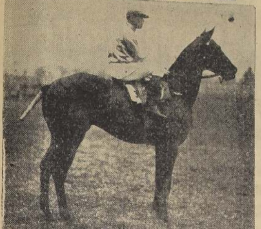
El MONARCA, 4 años, por El Tanajo y Mala Noticia, ganador del premio Ayacucho, sobre 2,200 metros. — Jockey, F. Santander.

mente, Bacchus Rex, Coligny y Kyra, no ocuparon puestos en el marcador.