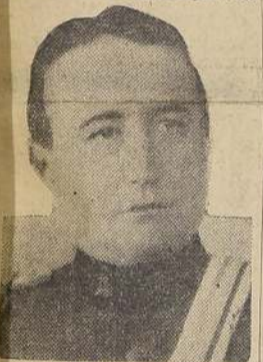
General Ambrosio Viaux

El Ministerio del Interior ha dictado un decreto por el cual declara que en caso de enfermedad o ausencia del Intendente de Santiago, ocupará este