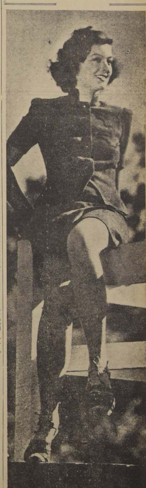
La hermosa estrella Myrna Loy, de los Estudios Metro Goldwyn Mayer, descansa después de las fatigosas tareas del set.