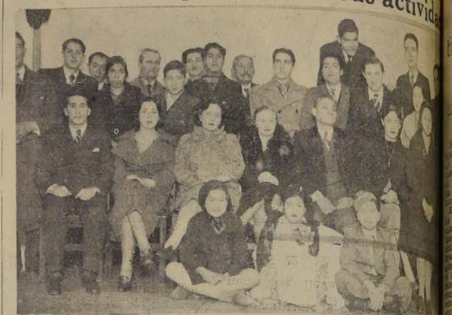
Dirigentes y socios de la Sección Central de las "Galladas Culturales y Artísticas" a la reunión inaugural de sus actividades sociales, con la delegación de la Sección Provincial. Estas instituciones colaboran en el próximo homenaje popular a Sarmiento, en el Teatro Esquella.