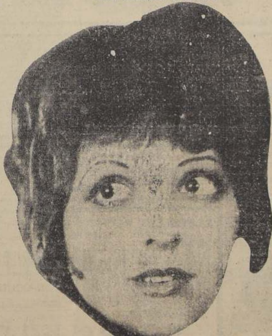
(CLARA BOW, una de las figuras mundiales del cine, que forma parte de los elencos PARAMOUNT)

PARA ESTA EMPRESA NO HAY CLASIFICACION DE TEMPORADAS: TODAS SON BUENAS. PORQUE BUENAS SON LAS OBRAS DE SUS FECUNDOS ESTUDIOS.—DONDE QUIERA QUE SE HAGA PRESENTE, SE IMPONE Y LOGRA TRIUNFOS EFECTIVOS.—"AMOR QUE REDIME" SE REPITE HOY EN LOS TEATROS SPLENDID E IMPERIO