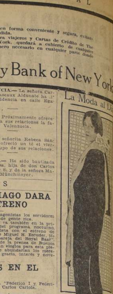
La Moda al Día

"SUCESOS" De mañana jueves 29 AHUMADA 32.—SANTIAGO Lt.—X.