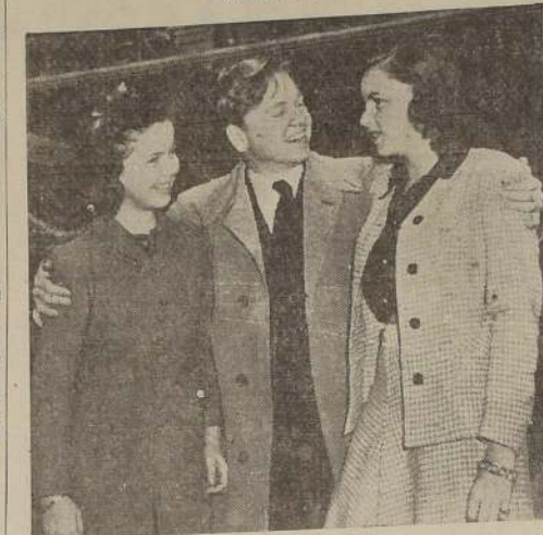
Shirley Temple se encuentra con Mickey Rooney y Judy Garland en los escenarios de los estudios de la Metro-Goldwyn Mayer, mientras filmaba "La niña olvidada". Fácilmente puede verse, por esta foto, lo que ha crecido la inolvidable Shirley.

En las funciones de matinee, vermuth y noche de mañana, estrenará el Metro la primera película de Shirley Temple, después de su alejamiento de la pantalla. Se titula esta producción "La niña olvidada" y pertenece al sello de la Metro Goldwyn Mayer. El tiempo ha hecho de Shirley Temple una niña más dulce... más atractiva... más bella... más que nunca. ¡Preciosa en su primer traje de baile! Toda una encantadora señorita! "La niña olvidada" es la historia de una muchachita, hija de padres muy ricos, que vive tristemente sola en una lujosa mansión. La falta de cariño de sus padres lleva a la niña a buscar la amistad de un viejo vendedor de trastos. Una nueva ama de llaves, y una futura madrastra, complican las cosas en forma tal que el argumento adquiere sus leves tintes dramáticos. Pero en toda la obra reina la alegría contagiosa de Shirley Temple, alegria que vibra en su sonrisa, la que a pesar del tiempo no ha perdido su encantador infantilismo. Herbert Marshall, Laraine Day, Gail Patrick y Félix Bressart, son los famosos artistas que encabezan el elenco que protagoniza esta nueva película de Shirley Temple.