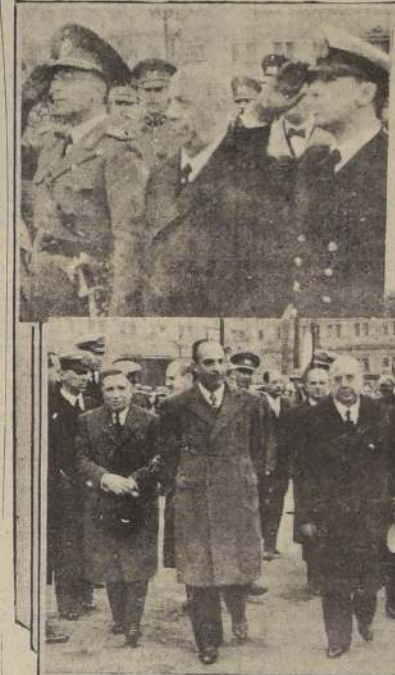
Diversos aspectos de la ceremonia efectuada ante el monumento de O'Higgins, cuyo pie depositó una corona el Canciller uruguayo

Este viaje se ha programado a petición expresa del Excmo. señor Guani, quien desde hacía largos años tenía el deseo de visitar el famoso balneario chileno. Asimismo, visitará el puerto de Valparaíso, para llegar hasta las aguas mismas del Pacífico.