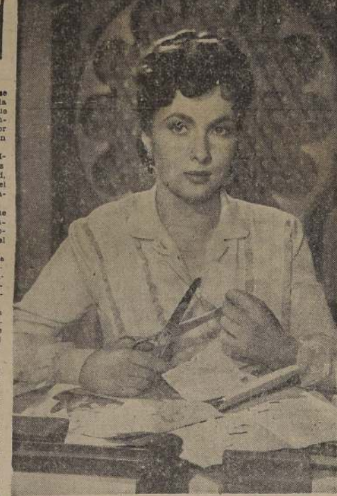
GINA LOLLOBRIGIDA, provocante beldad del cine italiano, será una de las tres "Beldades nocturnas", elegidas por el director francés René Clair, para trabajar junto al galán Gerard Philippe. La acompañan en la cinta Martine Carol y Silvana Pampanini.