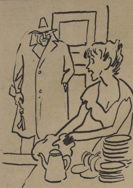
—Primero, un verdadero aventurero no deja que su mujer- cía lave la vajilla solita.