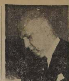
Exposición del pintor Luis Lazzaro Avalos será inaugurada mañana

En la audición radial "Arte y Cultura de América", que se transmite por Radio "Santiago", se rindió en la tarde de