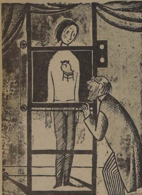
Tiene el corazón fatigado...