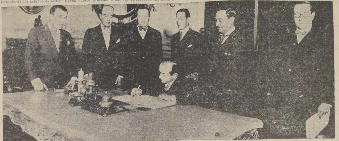
El Canciller, don Conrado Ríos Gallardo, en la sala de su despacho, en el momento de firmar el Protocolo de entrega de la sección chilena del Ferrocarril de Arica a La Paz

Bolivia asistieron con una ligera inclinación de cabeza y acto seguido el Excmo. señor Ríos Gallardo