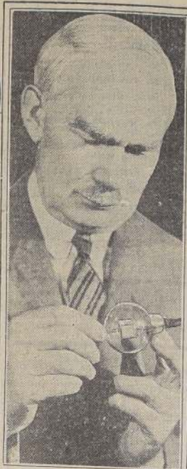
DR. LEE DE FOREST.