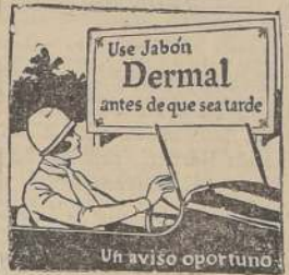
Un aviso oportuno.