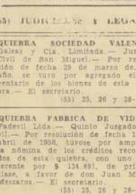
JUDICIALES Y LEGALES

JUDICIALES Y LEGALES. Juzgado Civil de San Miguel. — Por resolución de fecha 28 de marzo de 1958, se tuvo por agregado el inventario de los bienes de esta querría. — El secretario. (18) 26, 28 y 29-4 C.