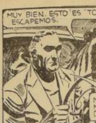
TARZAN — 5173