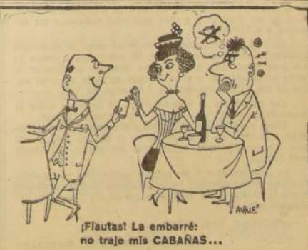
¡Flautas! La embarré: no traje mis CABAÑAS...