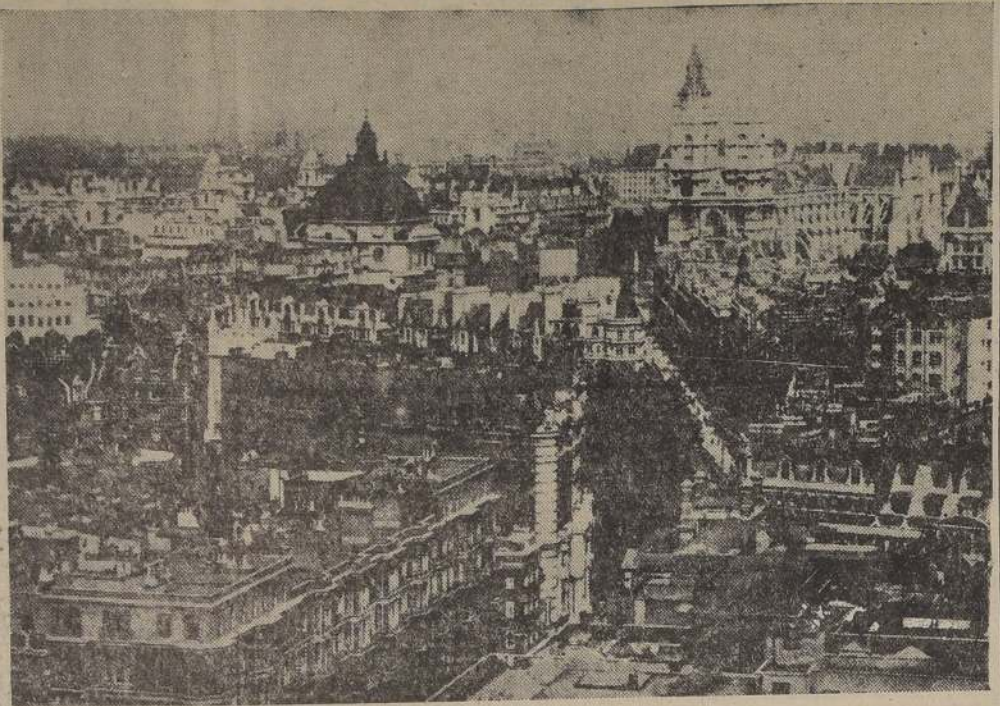
Panorama de la capital inglesa que sufrió anoche uno de los bombardeos más intensos de la guerra.

Miembros de la United Press que no estaban de servicio, informaron que el ataque había sido tan extenso como intenso. Los observadores de incendios