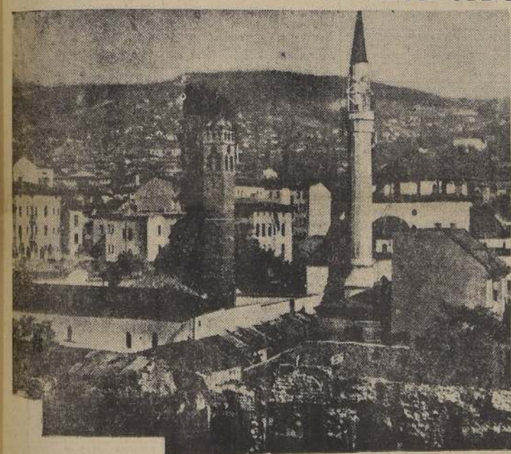
Ciudad de Sarajevo en Yugoslavia, a la que ayer entraron los alemanes.