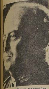
Mariscal Oscar Benavides

El Mariscal O. Benavides partirá a B. Aires a hacerse cargo de la Embajada