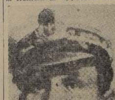
Duque de Aosta, virrey de Etiopía

En las esferas militares se ha informado que en Sollum en la frontera de Egipto con Libia