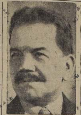
Excmo. señor Aguirre Cerda, a cuya obra social tributa su aplauso la Cooperativa de Huertos Obreros José Maza

La dictación de la ley que destina fondos para la organización y funcionamiento de los huertos obreros en Chile, ha motivado un justificado entusiasmo en aquellas colectividades que, como la Cooperativa José Maza, no sólo iniciaron su estudio y aprobación por el Congreso, sino que la impulsaron a través de toda su tramitación por los Poderes Públicos.