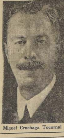
Miguel Cruchaga Tocornal

WASHINGTON, 5. — Se ha dirigido a Nueva York, el señor Miguel Cruchaga, ex-Embajador de Chile en los Estados Unidos. El señor Cruchaga se embarcará el miércoles próximo, a bordo del vapor "Ebro", en viaje a Chile. (U. P.)