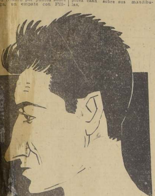
Sánchez Mi record

En forma especial la empresa nos pide hacer presente a los interesados que la pelea se llevará a cabo aunque llueva.