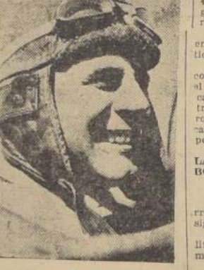
James A. Doolittle

NUEVA YORK, 5. — El teniente James A. Doolittle, que proyecta establecer un record con un vuelo a Sud América en un avión militar "Curtis Special", ha anunciado que se ha visto obligado a postergar su partida, debido a que ayer su avión se destruyó parcialmente durante un vuelo de prueba en el Aeródromo Mitchell. (U. P.)