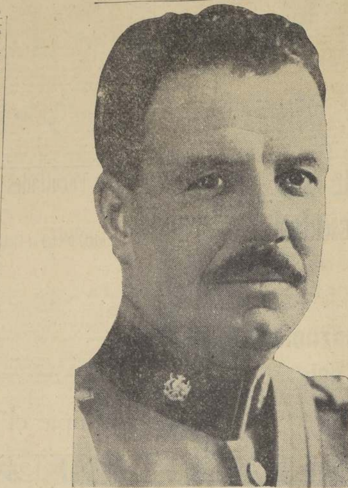
S. E. el Presidente de la República, Excmo. señor don Carlos Ibáñez del C., a quien se festeja hoy en todo el país.

Ovalle, Petorca, San Antonio, Cauquenes, Lota, Angol, Los Angeles, Mulchén, Chillán, Coronel, Lautaro, Hualpé, Peralillo, Ligarero, Tomé, La Serena, Peñaflor, San Fernando, El Monte, Talagante, San Antonio, Cartagena, Lillo, San Carlos, Castro, Constitución, Naltagua, Coquimbo, Parral, Chanco, Arica, Concepción, Iquique, Rancagua, Sewell,