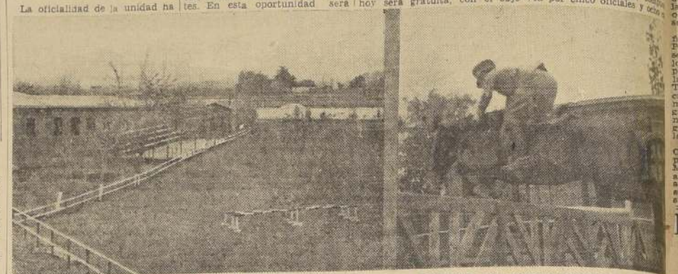
EL NUEVO JARDIN DE SALTOS QUE SE INAUGURA HOY

de dar una oportunidad para que asista todo el público que se interese.