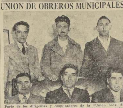
Parte de los dirigentes y cooperadores de la "Unión Local de Obreros Municipales de Providencia", asociación que activa interesantes aspiraciones de orden social y económico.