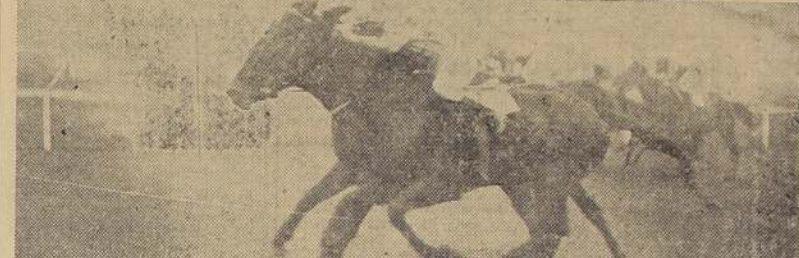
En postre esfuerzo Troutbeck aventaja a Naranjal por 1/2 cabeza; tercero Sagitario delante de Wednesday.

Es sensible que en una prueba de esta importancia, se haya producido el orden, pero en realidad la medida se hacía necesaria, y en consecuencia el Comisario no hizo más que cumplir con su deber, al aplicar uno de los más serios artículos del reglamento.