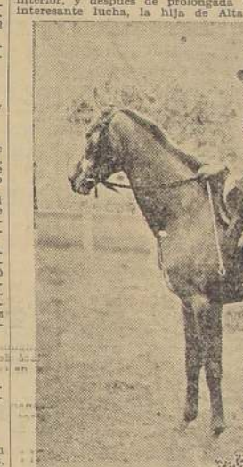
Moussia, 3 años, por Royal Alarm y La Taper, que confirmó sus calidades al imponerse en la cuarta carrera. — Jinete, B. González.

placó al frente, pero luego fué substituida por Dignidad, quedando entonces segunda Alicahuina, y a continuación, Omoana, Igriega, Acrobata, Cuerpo a Cuerpo, Titina, El Quafi, y al fondo, Alma Fuerte, a respetable distancia. Una vez en tierra derecha, Alicahuina pasó a la vanguardia, pero al enfrentar las populares, Omoana, reaccionó bravamente por el lado interior, y después de prolongada e interesante lucha, la hija de Alta-