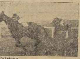
Omoana, en reinado final, da cuenta de Alicahuina, Igriega y Catriona.

Tantehus, y cerrando el paso Old Times. Moussia, con apreciable ventaja llegó al derecho final, y sin enemigos se fué al disco, y aunque en los últimos tramos, Amalthée, descomentó mucho terreno, no pudo nada delante de la pupila de Lacalle, que acabó por batir al galope por 2 largos cuerpos. El tercer lugar, a 4 cuerpos correspondió a Tainud, delante de Miramar. Tiempo: 1:37.25. No corrieron Water Polo, Balata y Yara. Jinete de la ganadora, B. González. Preparador, Constantino Lacalle.