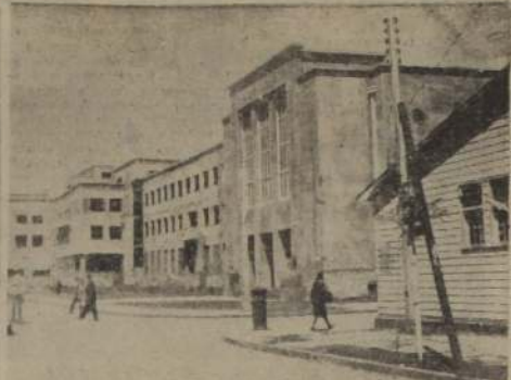
Edificio en construcción de la nueva Municipalidad, y en la Casa del Arte de Chillan. Se presentará un Memorial a S. E. sobre los problemas de la ciudad y de la provincia de Suble.

Esta partida es de ochenta toneladas y comprende 4.800 reses entre chiporros (lechones) y corderos corrientes. En el curso del próximo mes, nuevas partidas de carne congelada de corderos de Magallanes comenzarán a llegar a Valparaíso, pero en cantidades muy superiores a las del año pasado con el objeto de atender al consumo interno de la población. El vapor "Antártico" de la misma firma naviera traerá cien toneladas de corderos corrientes.