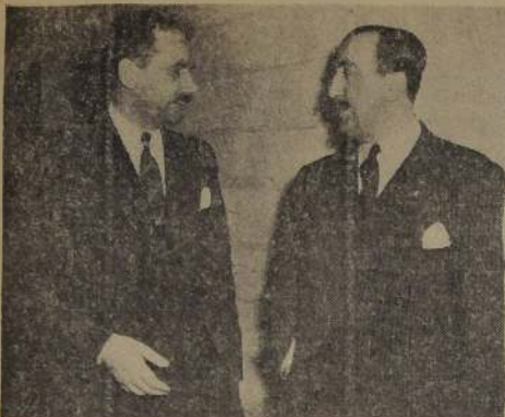
LAKE SUCCESS. — Hernán Santa Cruz, a la derecha, conversa con el delegado de Checoslovaquia, Papanek, antes de que este último entre a la sesión del Consejo de Seguridad del 23 de abril, durante la cual se discutió el golpe comunista en Checoslovaquia. El Consejo aprobó por 9 votos contra 2 escuchar a Papanek.