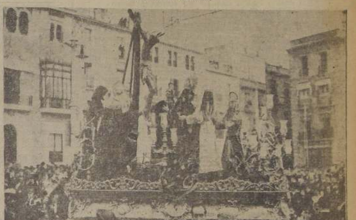
SEMANA SANTA EN SEVILLA.— El Santísimo Cristo de las Cinco Llagas a su paso por la Plaza de la Constitución.