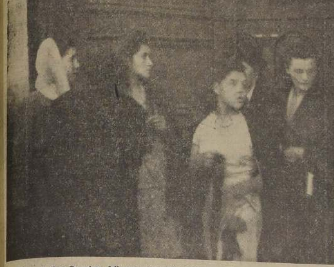
En la Iglesia de San Francisco, feligreses rezan las oraciones alusivas a los oficios del Jueves Santo.— En todos los templos de la capital hubo ayer gran concurrencia de fieles de todas edades y clases sociales.

Las festividades en Roma, París, Madrid y en Londres