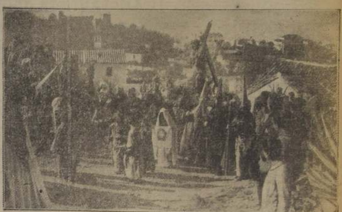
GRANADA.— La célebre Cofradía albaicenera del Cristo de El Salvador, que recorre las más típicas calles del Albaicín.

Roma, la ciudad en que se mezclan los soberbios recuerdos de los cesáres con los humildes ejemplos de Pedro el Pescador, no se engaña para solemnizar el perdón concedido por el Padre a la Humanidad, a cambio de la sangre del Hijo. Todo es en estos días recogimiento y devoción callada en la ciudad del Tiber. La Basílica del Vaticano, abierta día y noche recibe la visita de millares de almas tristes y en penitencia. A no ser por la gran muchedumbre que llena sus inmensas naves, no se advertiría que la Iglesia conmemora la fundación de sus doce.