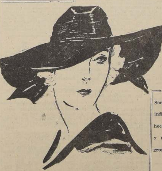
Gran sombrero en fieltro negro adornado de gran nudo atrás en cinta de raso.

CUENTAS CLARAS 1 ALIVIO POR $0.40 3 ALIVIOLES (EN UN SOBRE) POR $1.00