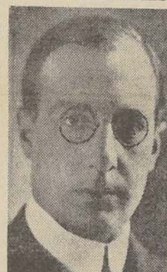
Don Ernesto Barros Jarpa.