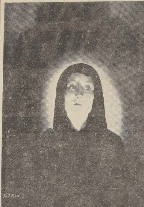
Gloria Holden, que protagoniza la película "La Hija de Dracula", que estrena hoy el Baquedano.

Con uno de los argumentos más originales que se hayan explotado para el cine, la Universal Pictures, ha logrado hacer esta película, cuyos relieves son interesantísimos y la interpretación pone en juego toda la gama de sus desempeños.