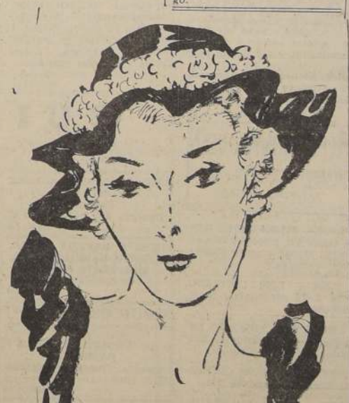
Esta hermosa capelina está inspirada a la moda de Carlota Corday, heroína de la Revolución Francesa. Es en fieltro negro con pliegues, rodeada de flores en tonos rosas.

Sombrero inspirado en la influencia española. Está hecho de terciopelo negro y nudo atrás en cinta gros-grain. Fino velo cae en derredor.