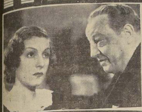
Consortio Cinematográfico de Chile

ORDEN DEL ESPECTACULO: 1. AUTO BUCEANDO, dibujos animados. 2. SINOPSIS de ADVERSIDAD, por Fredric March. 3. NOTICARIO UNIVERSAL con las actualidades de la revolución española. 4. Setete Central. 5. Presentación de SAMSON (aprobada solo para mayores de 15 años; no recomendable para señoritas).