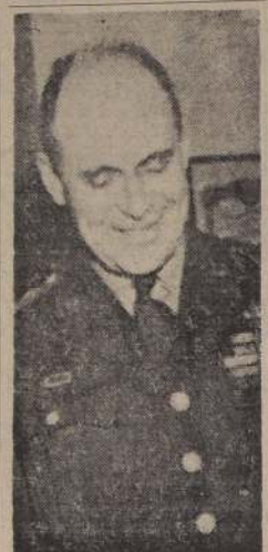
MATTHEW RIDGWAY: No podemos atenuar nuestros esfuerzos.

Finalmente opinó que no había lugar a una actitud pasiva ante la conocida expansión del Kremlin en los campos de los armamentos corrientes, el progreso que, se calcula, hace en el terreno de la energía atómica y otros no convencionales, y su implacable hostilidad hacia Estados Unidos.