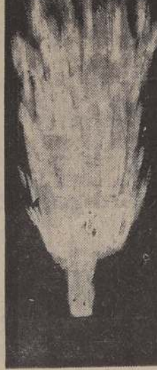
Las Ondas de choque opuestas de dos "cargas dirigidas", explotadas y concentradas en un punto matemático, logran la fusión de los núcleos atómicos de hidrógeno, convirtiendo a éste en helio y liberando gigantesca cantidad de energía para uso industrial en motores y turbinas.

Una vez que se emplee la energía-H para propulsión de turbinas y motores se invertirán los temores de los físicos, que hace tres años temblaban ante la idea de que llegara a ser un hecho la bomba de hidrógeno, cuando el Gobierno norteamericano ordenó su construcción. En fin de cuentas, la captación de los fuegos infernales de nuestro astro-rey va a ser una felicidad y no una desgracia para los seres humanos. Su amansamiento y canalización hacia usos pacíficos es la coronación del triunfo de los científicos atómicos. — Dr. C.