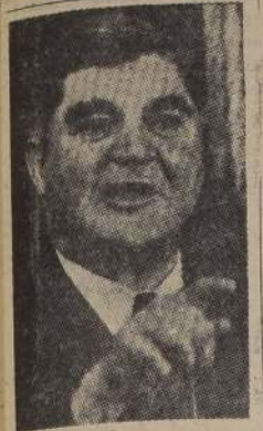
BEVAN: Acusa de torpeza diplomática.