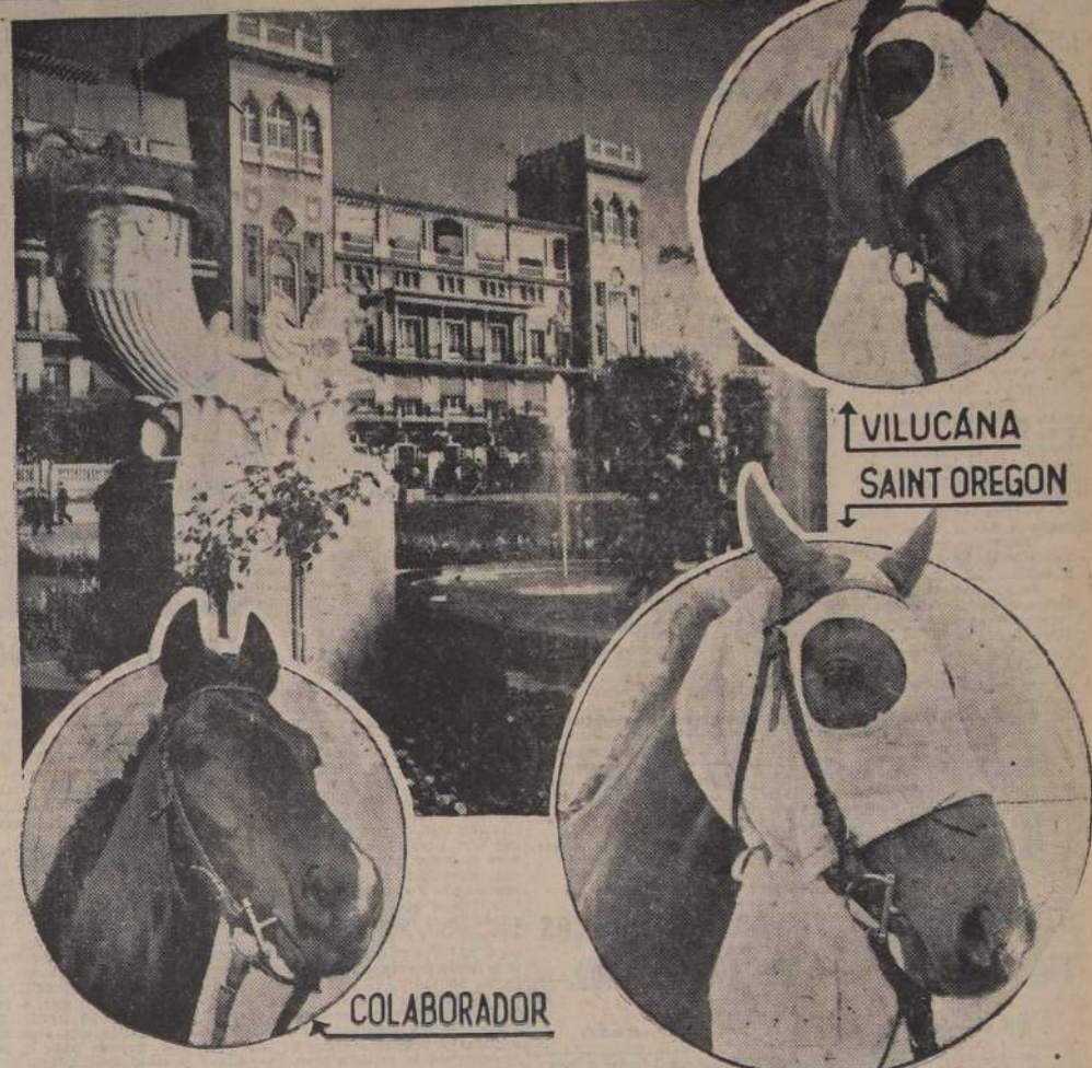
VILUCANA SAINT OREGON