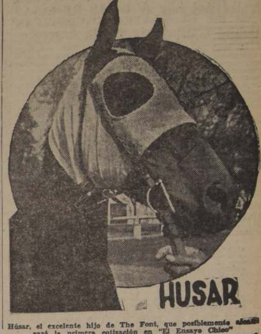
Húsar, el excelente hijo de The Font, que posiblemente será la primera cotización en "El Ensayo Chileno"