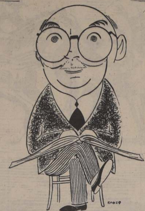
EDUARDO BARRIOS (Dibujo de Tadeo)

Los pedagogos primarios y secundarios que devienen pedagogos exhiben rigidez que deshumaniza y convierte en seres unilaterales, con visión enloquecida, fría, que no rebasa las cuatro paredes de una sala de clases o de una biblioteca. Se enfrentan, pueriles con métodos y reformas, y es muy fácil que tomen a los andamios por el edificio; con el tiempo adquieren mansedumbre pasiva, a tal punto que no se ríen tanguen poder y temor de habérselas con problemas sustanciales. Prefieren agruparse en asociaciones donde se especulan hasta quedar exhaustos como corrientes de agua de intensos ímpetus docentes. Cuando celebran vastas y sonadas convenciones, ya puede uno estar seguro de que en ellas se tratarán temas que en nada afectan a la realidad educativa concreta e inmediata, sino, se discutirán más bien en detalle recónditos conceptos, de tan bizantino perfil como los que insinúan a algunos catequizados, medievales a estudiar cuántos ángeles