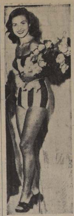
MISS MUNDO. — LONDRES.

La eventual liquidación de ese excedente ya está afectando al mercado. La impresión que predomina en Londres es que los precios mundiales del cobre seguirán pareciendo irracionales mientras no se llegue a una decisión en las negociaciones chileno-norteamericanas y sigan pendiendo otras cuestiones relacionadas con la liquidación del sobrante y la futura producción de Chile.