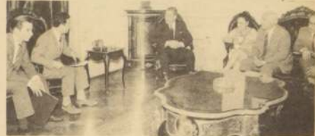
PIDEN MEJORAMIENTO. Mejores condiciones económicas solicitaron al Presidente Frei los dirigentes de la Asociación de Empleados del Instituto de Seguros del Estado. S. E. prometió incluirlos dentro de la Ley de Reforma a las Sociedades Anónimas. En el grabado, un aspecto de la entrevista.