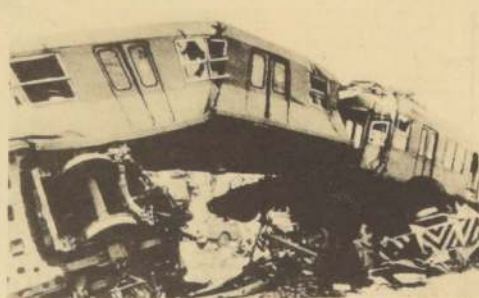
MAEBASHI, JAPON. Seis muertos y cien personas heridas fue el trágico saldo dejado en el accidente ferroviario, protagonizado por un tren de pasajeros y un camión grúa, que se partió en dos al ser lanzado contra varios automóviles por la fuerza de la colisión.

La policía suspendió todo el tráfico en el centro de Milán para abrir paso a las ambulancias.