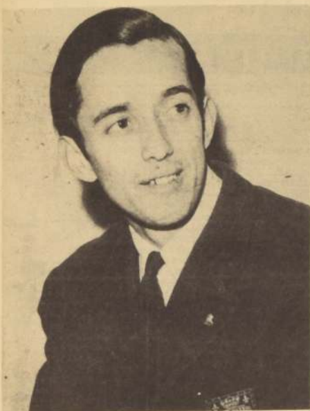
El Pato: otro de los números con pluma en la entrega de medallas.