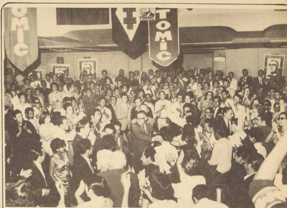
La desbordante multitud de anoche en el Teatro Baquedano ratificó algo sabido: que en la capital no hay escenario suficiente para contener a las multitudes que adhieren a la candidatura presidencial de Radomiro Tomic. El aspecto novedoso fue la activa participación de la juventud, expresada en un entusiasmo que se mantuvo durante todo el desarrollo de la proclamación del candidato de la Democracia Cristiana.