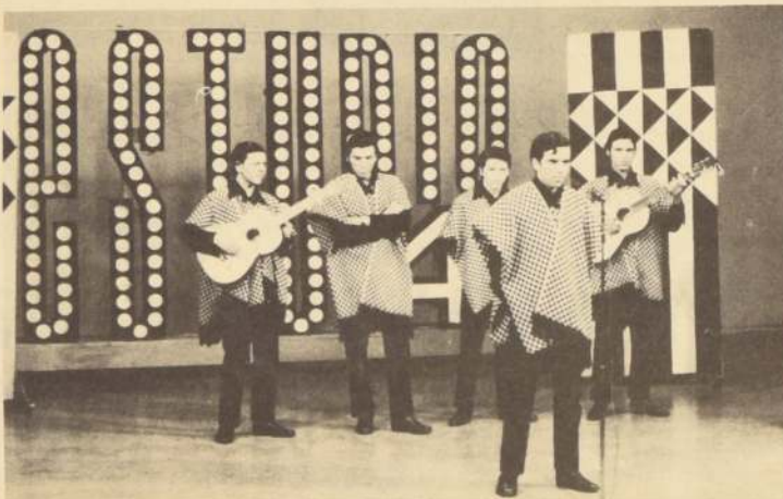
Los Alfiles Negros actuando en "Studio 4". También se imponen en Lima. Ahora viajan a Panamá.