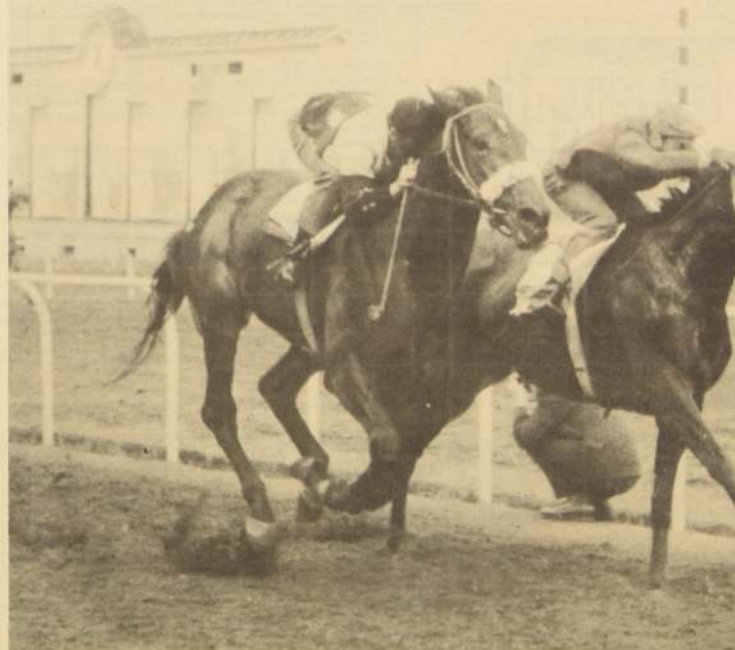
ESPAÑOL a quien vemos, por los palos, anima la prueba central de La Palma. Al amparo de los kilos podría sorprender.