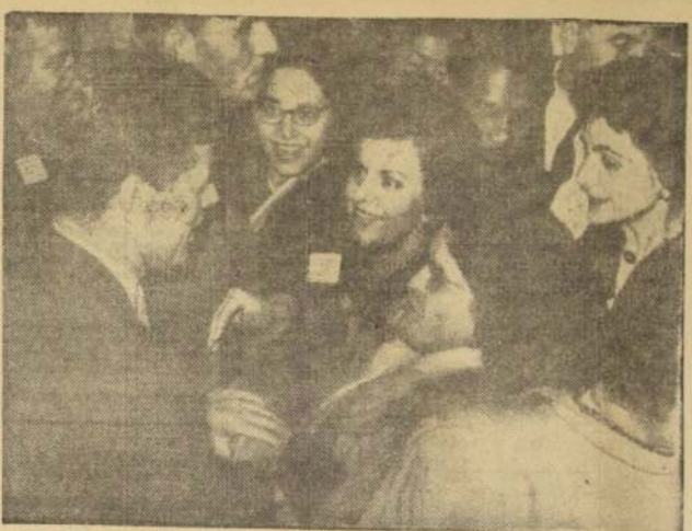
KENNEDY SALUDA A DELEGADOS EXTRANJEROS: El Presidente John Kennedy saluda a un grupo de delegados extranjeros que asisten a la Conferencia de Salud, Educación y Bienestar, que se celebra en Washington.

WASHINGTON, Feb. 22. — (Por Arnold Otero). — (UPI). — Los Estados Unidos han sometido a un estudio una petición recibida del gobierno de Guatemala para que se celebren conversaciones formales inmediatas sobre la infiltración comunista en Latinoamérica a través de Cuba.