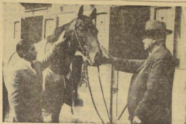
PRINCE MEDICIS se viene a la capital. Será el gran animador de los grandes clásicos.