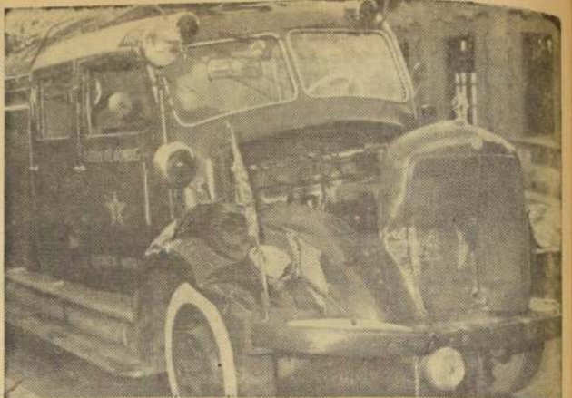
QUINTA NORMAL. —El único carro bomba con que contaba la comuna fue chocado por un camión en calle San Pablo esquina de Radal. En el grabado aparece el estado en que quedó con el tren delantero, radiador y otras partes dañadas, con perjuicios que ascienden a 600 escudos.

LAS CLASES SE INICIARAN EL LUNES TRECE DE MARZO