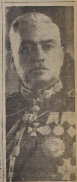
General don Ernesto Montagne, según informaciones oficiales, habría sido detenido en Lima.

LIMA, 15. — (UP). — El Gobierno Militar anunció haber sofocado el levantamiento en Arequipa, la segunda ciudad en importancia del Perú, y que ha hecho abortar un movimiento similar que debía estallar en esta capital. Añadió que la revolución era dirigida por el general Ernesto Montagne, quien fue candidato de la oposición a la presidencia de la República, para las elecciones del 2 de julio próximo, hasta que el Gobierno declaró hace poco que las candidaturas de la oposición no eran válidas por no ajustarse a la ley electoral. Las autoridades entregaron un comunicado en el que dice: "Este la "normalidad" ha sido ofrecida completamente. Los "detenidos" los "corrosivos" del siniestro plan. "Régimen" el movimiento "Alvia Mochi" corrió con el "Verdaderos" y "comunistas". También expresa que hubo derramamiento de sangre en Arequipa, pero sin dar detalles. Por su parte, las autoridades de Arequipa informaron que fueron muertos dos oficiales de Ejército y heridos diez soldados. Fuentes revolucionarias hacen ascender las bajas de ambos lados a 50 muertos y 200 heridos.