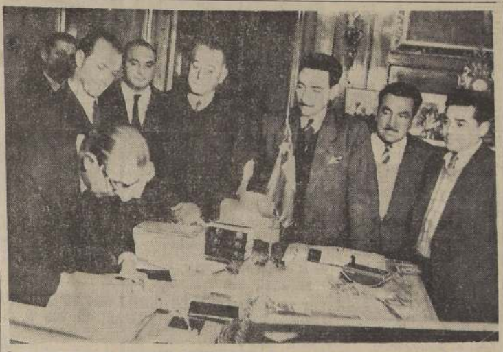
S. E. SOLUCIONA EL CONFLICTO AUTOBUSERO. — El Excmo. señor Gabriel González en el momento de firmar el acta por la cual se solucionan las diferencias existentes entre empresarios y choferes de microbuses. A su lado aparece el Ministro de Tierras y Colonización, don Ignacio Palma Vicuña, que tuvo destacada actuación en la gestación del arreglo y representantes de los dueños de buses y de los choferes.