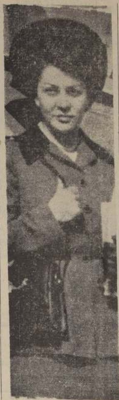
BECAJA POR LA FUNDACION ROCKEFELLER.

En cuanto al reciente conflicto de los personales de Correos y Telégrafos, la JUNECH declara que contribuyó en forma efectiva a la solución alcanzada, y "que hace un llamado a todos los empleados del país, para mantener una sólida disciplina y evitar acciones aisladas que comprometen a la organización que se reserva, con absoluta independencia, para dirigir la lucha general de todos los empleados frente a las maniobras con que se pretende burlar sus aspiraciones".