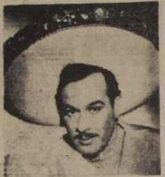
PEDRO INFANTE como buen actor cómico que lo es.