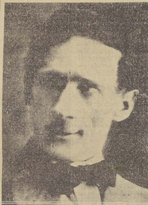
Pepe Vila el popular actor español que será festejado en el Teatro Santiago con una gran función de honor y beneficio

Los redactores teatrales de “El Mercurio”, “El Diario Ilustrado” y “La Nación”, comprendiendo el alto significado de este grandioso homenaje, han resuelto auspiciar debidamente este festival, contribuyendo con su experiencia a la preparación de un programa que, por todos capítulos, resultará magnífico.