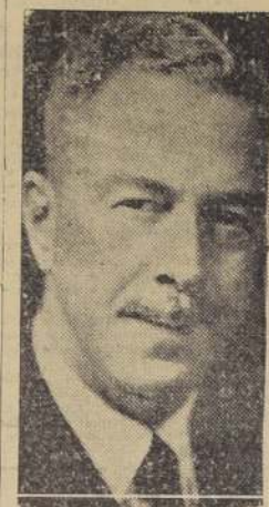
Don Miguel Cruchaga