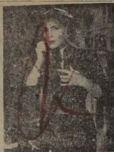
La actriz-cantante Libertad Lamarque interpreta a Elena, una mujer buena y abnegada, que lucha por defender la felicidad de su hogar y de sus hijos, en la película de Filmex "TE SIGO ESPERANDO", bajo la dirección de Tito Davison.