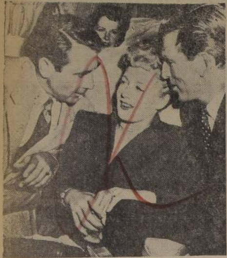
Gary Merrill, Shelley Winters y Michael Rennie, principales intérpretes del drama que ha conmovido a todos los públicos en sus exhibiciones del CINE REX, al iniciar ayer su segunda semana de triunfales exhibiciones.

Sigue el éxito en el Rex, del drama que conmueve a Santiago: "Llamada de un extraño"