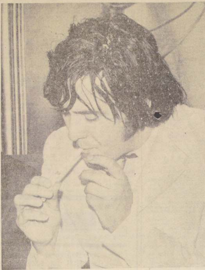
"Creo que la interpretación es más importante que la voz y la pinta", afirmó en la conferencia de prensa del lunes, Billy Bond, el Rebelde, quien se siente identificado con su terno "in" y su melena a lo Beatle.

Declaraciones de Billy Bond, el Rebelde, un cantante que puede llegar a ser tan popular en Chile como Sandro, Yaco Monti o Adamo. Actuó en los Sábados Alegres y bajó un kilo y medio. Vendría al Festival de Viña del Mar.