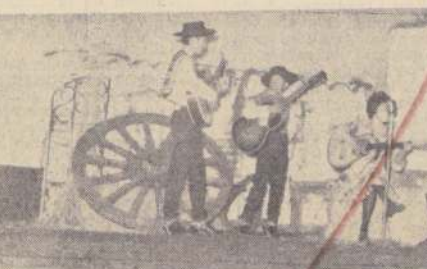
EL CONJUNTO FOLKLORICO General Insa, durante su presentación en el Teatro Municipal

El público aplaudió con entusiasmo todas las actuaciones y al final del programa elogió sin reservas la exitosa actuación.