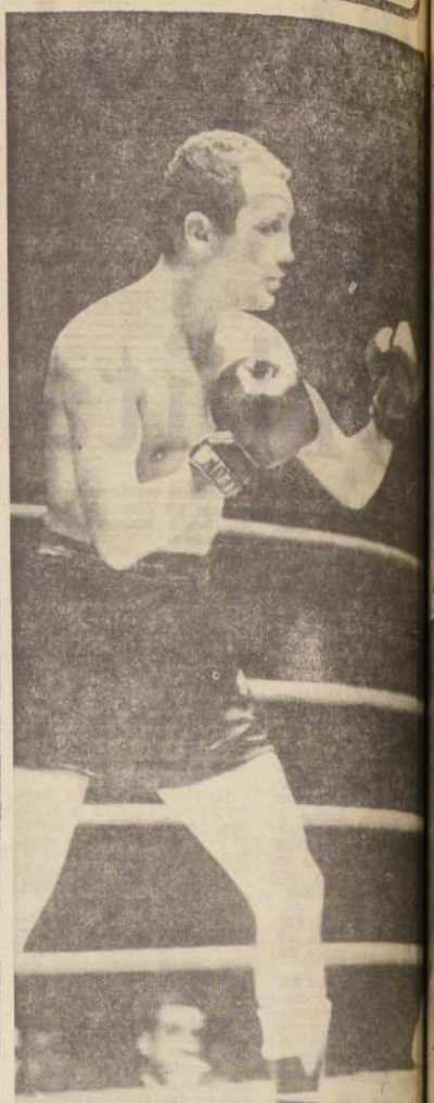
GODFREY STEVENS, campeón chileno y sudamericano, recibió un regalo de Navidad de la Asociación Mundial de Boxeo: lo colocaron décimo en el ranking mundial.