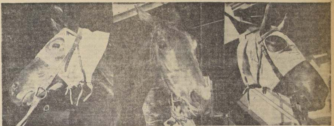
TRIPLE CORRAL CON LA PRIMERA OPCIÓN.— El prestigioso Stud "Lohengrin" presentará tres de- fensoras en la prueba destinada a potrancas gana- doras que se correrá en el séptimo lugar del pro- grama del Club Hípico. Las tres hembras se ven en muy

BIG CHANCELLOR, 55.— (R. Parodi).— Es estimado co- mo un potrillo de promisorio porvenir. Su última, un cuarto puesto de Port Said, sin haber corrido con suerte.