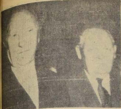
Adenauer manifestó que ha actuado teniendo en cuenta los intereses de todo el pueblo alemán