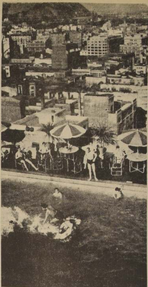
Un numeroso público se reúne diariamente en la hermosa Piscina del Hotel, donde disfruta del agua y del sol y admiran el panorama de nuestra ciudad.