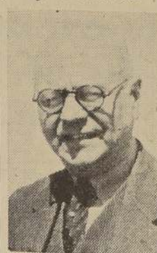
Después sus restos al Cementerio General.