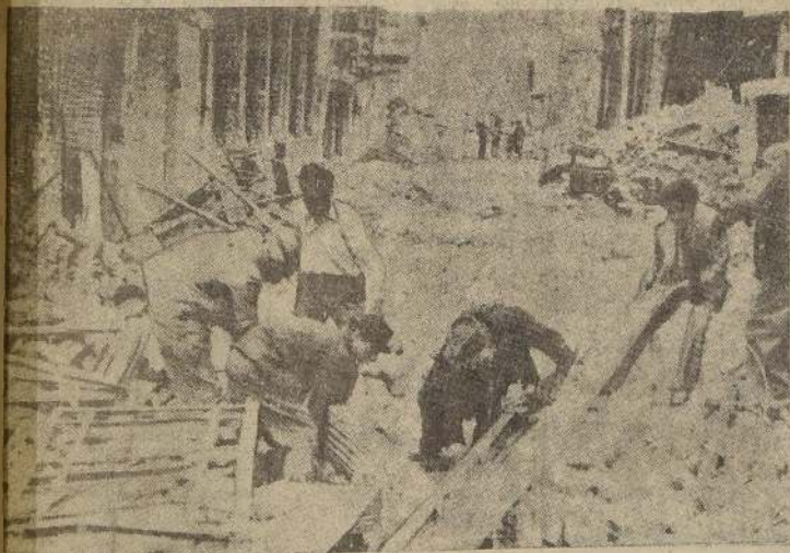
Un grupo de vecinos removiendo los escombros para retirar una de las víctimas que fue sepultada por el terremoto.