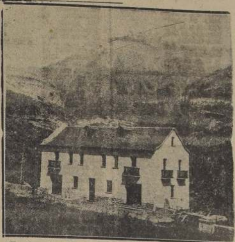
Un tipo de construcción de viviendas para las regiones devastadas.

Puede decirse que cada día se están produciendo en España nuevas viviendas baratas, para ser habitadas por la clase asalariada del país. De estas viviendas, algunas son de tipo moderno, otras de tipo antiguo. En el Ayuntamiento de Madrid, se ha firmado la escritura de adjudicación de terrenos para la construcción de un grupo de viviendas protegidas, por un valor de 1.800.000 pesetas, por valor REAL. Se ha inaugurado un grupo de viviendas para familias humildes. Todas las viviendas se han entregado con muebles y enseres. Ningún arrendatario pagará más de 15 pesetas al mes, etc.