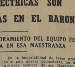
De las locomotoras que antes ocupaban en el servicio de los trenes locales, serán dejadas todas para los trenes de carga en algún tiempo habiéndose ya procedido a ajustar las nuevas necesidades, 4 de las locomotoras mencionadas, que tienen poder de un mil quinientos caballos de fuerza y que son llamadas "equino sobrañe".