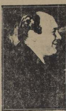
M. Pierre Henri Spaak, Ministro de Relaciones Exteriores de Bélgica

El mundo necesita un cambio de actitud. Hemos de eliminar el temor de otra guerra. Hemos de tener el valor de mirar a la cara a los hechos y de no permitir que el miedo nos paralice. Hemos de tener el valor de decir: "No volveré a ser víctima de la guerra".