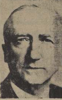
Mr. James F. Byrnes