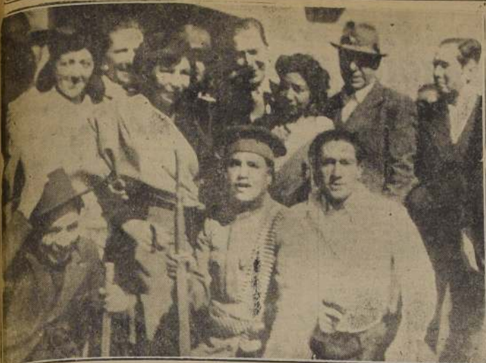
LA PAZ.—Un grupo de combatientes. Un alumno de la Escuela de Policía rodeado por estudiantes y obreros. El de la izquierda por toda arma lleva un garrote. Al comenzar el ataque final contra los reducidos oficiales, numerosas personas sólo disponían de machetes y garrotes.