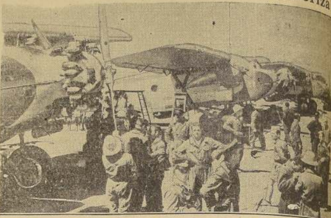
Las fuerzas italianas que continúan avanzando hacia el Sur en Etiopía, después de estos mensajeros del espacio, tanto para observación como para sembrar el miedo entre los tropas del Negus Negati, en forma de bombas. Esta foto muestra una flota de aviones italianos, con sus pilotos y mecánicos, esperando órdenes para "pegar" en la frontera entre Eritrea y Etiopía.