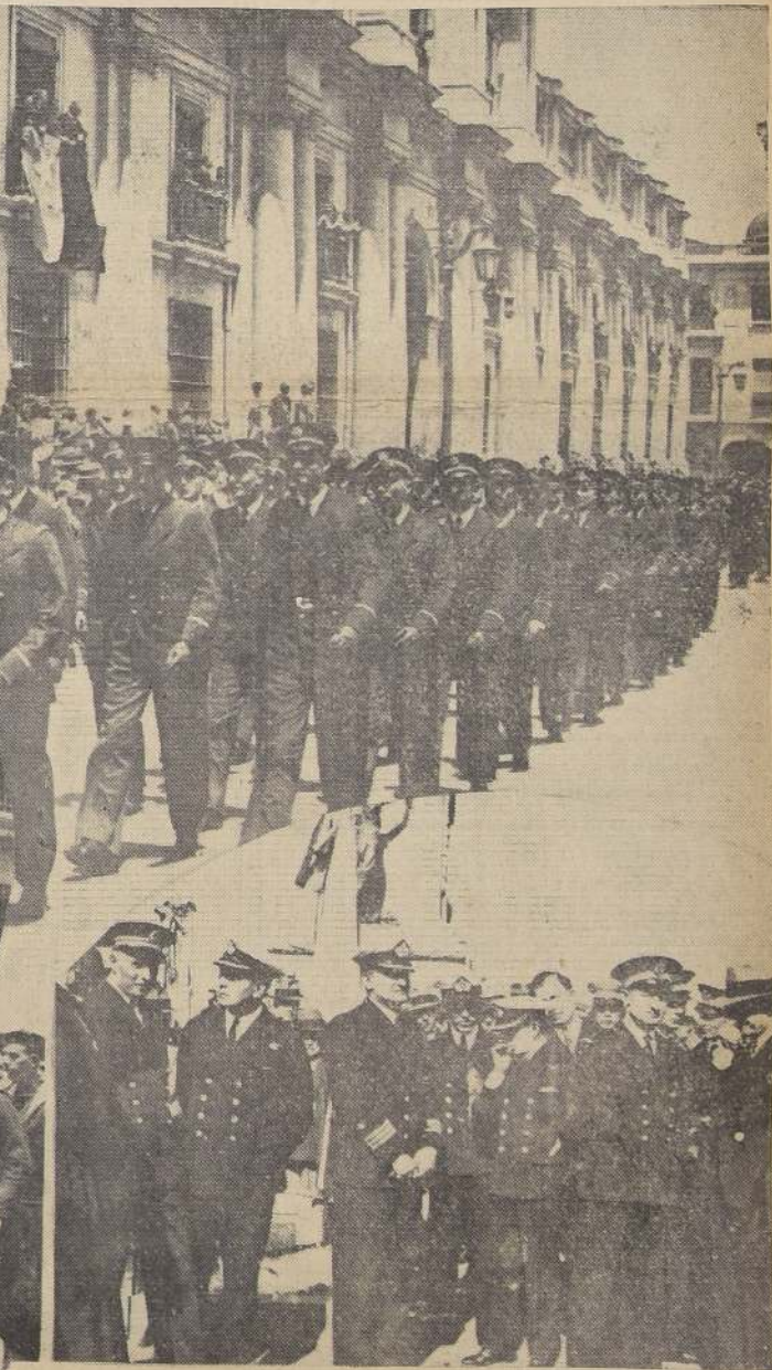
Diversos aspectos gráficos de la llegada y desfile ante S. E. el Presidente de la República, de la oficialidad y marinería del buque-escuela "Jeanne D'Arc".

Concurrieron, para solemnizar el acto, delegaciones de casi todas las reparticiones militares y numerosas bandadas de la guarnición.