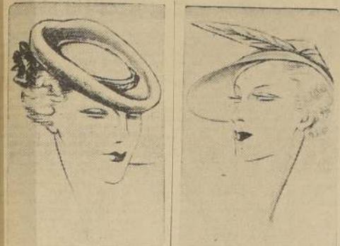
Ando modelo de sombrero en fieltro azul rey, guarnecido de cinta de raso negro