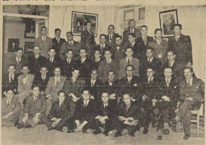
El Comité Universitario y el directorio del Bando de Piedad de Chile, que tienen a su cargo la organización de las Fiestas de la Primavera del presente año, que se efectuarán del 24 al 27 del presente