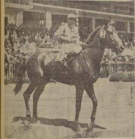
DOTAFAGO, el corredor hijo de Oakland, que mañana, en la competencia central del programa hípico, cargará con el mayor peso