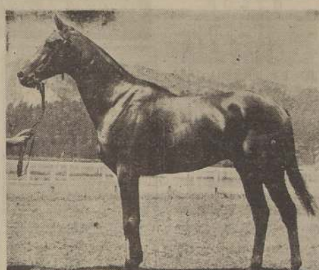
BON VIN, que al imponerse en el premio "Independencia", corrió en esta pista y distancia, hubo de recurrir a sus mejores esfuerzos para detener a Galileo