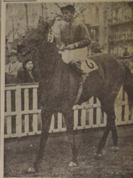
EXCELSIOR, es para muchos entendidos la sorpresa precisa, preciosa de la carrera, lo que no cuesta creer, si se tiene en cuenta que fue cuarto de Brickdust, Sterling y Madison