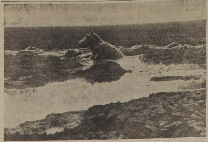
CEMENTERIO DE HIPOPOTAMOS.— Tanganyika, África.— Dos años de sequía dejaron sin agua el lago Rukwa, en el valle de Rift, en Tanganyika. Manadas de hipopótamos comenzaron a morir en medio del lago seco o del barro que quedó. Muy pocos de estos animales sobrevivieron a la sequía, para ser refrigerados por las lluvias de este año.— (Foto ACME).

Una encuesta realizada entre los delegados, revela pronósticos contradictorios respecto a la decisión de Abdullah de enviar una delegación completa a Amman. Algunos creen que Abdullah aceptará el pacto de seguridad colectivo, pero otros creen que no lo hará.