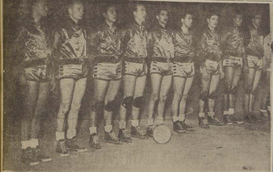
El equipo de la UNIVERSIDAD DE CHILE, campeón de básquetbol del país, será uno de los que tendrá más responsabilidad en las próximas temporadas internacionales, en que actuarán el Seleccionado Mexicano y el equipo del Sporting de Montevideo. Los aztecas debutan el martes próximo en la cancha del Estadio Chile.