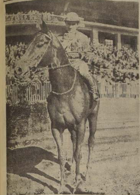
STERLING se presenta como un "crudo" rival de los más indicados, por su llegada de segundo en este tiro, escoltando a Brickdust.