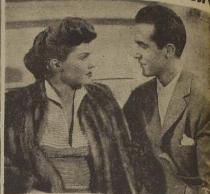
La bella Esther Williams conversa animadamente con el Ricardo Montalban, en una escena de "La hija de Neptuno".

La pantalla de vidrio es un nuevo telón para proyectar películas o escrían, como también se le llama. Su característica consiste en estar confeccionada por millones de millones de microscópicas fibras de hilo de vidrio. Tiene las siguientes cualidades sobre los demás telones, que cuenta el cine hasta ahora: una mayor nitidez, mayor luminosidad y mayor brillo; aparte de esto, deja pasar, a través de sus tejidos, todo el sonido de los altoparlantes que se encuentran situados detrás de la pantalla. Los