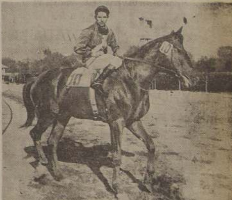
MADISON, que en su última actuación finalizó en tabla en la distancia, se presenta a la justa prestigiado por buenos apromentes