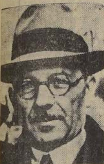
Saragolju, Primer Ministro turco, quien pronunció ayer un significativo discurso sobre las relaciones de su país con Rusia.

ANGORA, 17. — (U. P.). — El Primer Ministro Chukru Saragolju, en un discurso sensacional pronunciado ante el Parlamento de Turquía, hizo a Rusia ofrecimientos de amistad sin precedentes y reafirmó calientemente las alianzas de amistad ruso-turcas y Anglo-turcas. El discurso ha sido una de las más francas declaraciones en favor de las Naciones Unidas manifestadas hasta ahora por un país neutral, y los círculos aliados de ésta afirman que refleja la creencia creciente entre los países neutrales de que la victoria de las Naciones Unidas es segura.