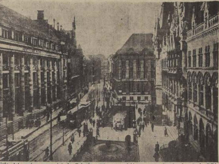
Vista del centro comercial de Colonia, que ayer sufrió un nuevo bombardeo de la RFA.