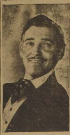
Clark Gable en el rol de Rhett Butler, en la producción "Lo que el viento se llevó", alcanza el punto máximo de su carrera.

Aunque "Lo que el viento se llevó" se estrenó oficialmente el próximo viernes 27, en las tres funciones, matinee, vespertino y noche, nuestra ciudad ya en antecedentes sobre el gran espectáculo del Teatro Metro de esta función extraordinaria, la noche antes del estreno, a las 9.30, para donar la entrada íntegra, sin descuento alguno, para la Pascua de los Niños Pobres que patrocinó la esposa de S. E. don Juan Aguirre de Aguirre Cerdá. Para