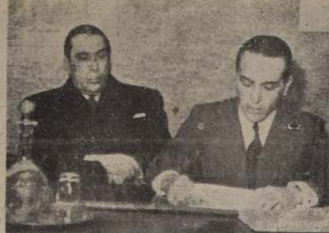
El Agregado Comercial de la Embajada del Brasil, señor Leite Ribeiro, durante su disertación

que el Centro Internacional Latinoamericano realizará en honor de la República hermana del Brasil, con ocasión de su aniversario nacional. Se desarrollará un interesante programa de disertaciones y números de arte, a los que seguirá una fiesta social. Se invita a las instituciones obreras en general.